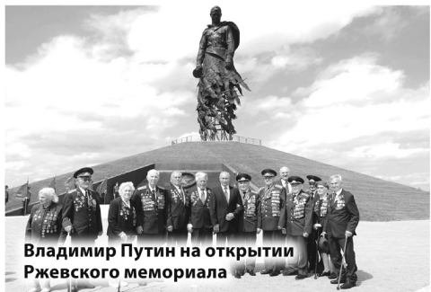
Владимир Путин на открытии Ржевского мемориала

Многие переживали: уж не забыл ли Президент о кадровых ожиданиях в регионе?