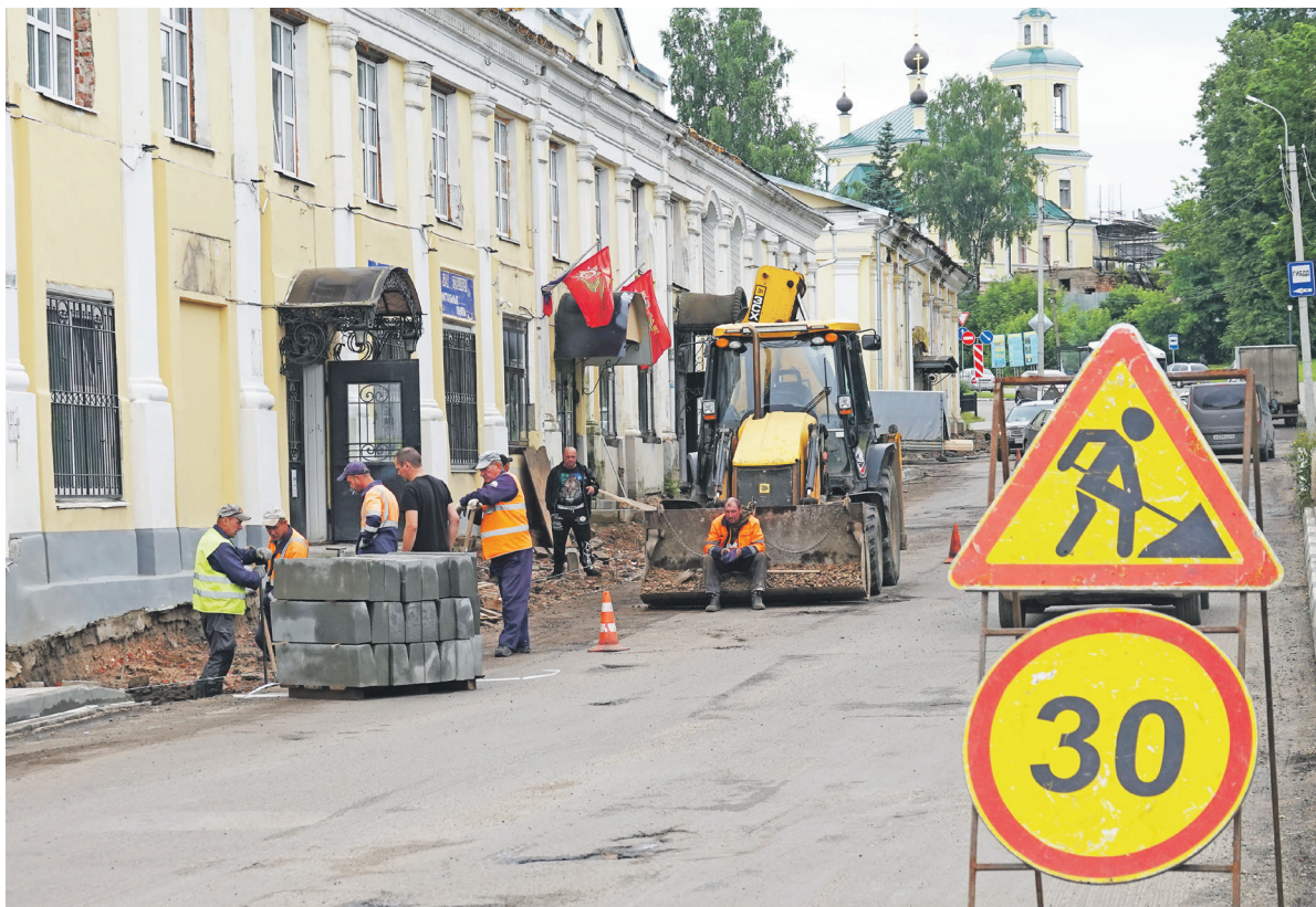
Улица Торговые ряды.

зону работ, устройство тротуара по ул. Кирова (четная сторона), ремонт существующего тротуара по пер. Пионерскому, укрепление обочин, установку пешеходного ограждения в местах, определенных решением комиссии по обеспечению безопасности дорожного движения (ТСОДД): искусственные дорожные неровности, дорожные знаки, горизонтальная дорожная разметка, ограждения пешеходных переходов в районе образовательных учреждений в соответствии с действующим проектом организации дорожного движения.