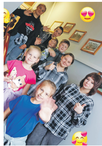
До свидания, лагерь!

Впереди у ребят летние каникулы, а у педагогов отпуск. Всем активного отдыха, неиссякаемой энергии и доброго настроения!