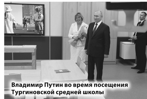
Владимир Путин во время посещения Тургиновской средней школы

После случившегося на недавнем совещании по ВКС цель кажется вполне реальной: раз Президент по-особому относится к региону, подобрал для него особого руководителя из своего кадрового резерва и полностью ему доверяет, грех не воспользоваться таким имеющимся у нас ресурсом.