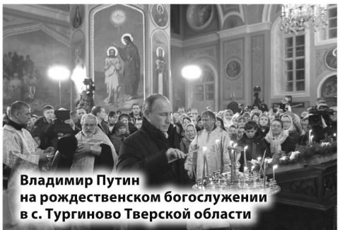
Владимир Путин на рождественском богослужении в с. Тургиново Тверской области