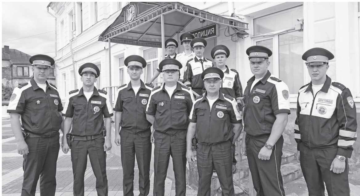
Сотрудники ГАИ МО МВД России «Торжокский».