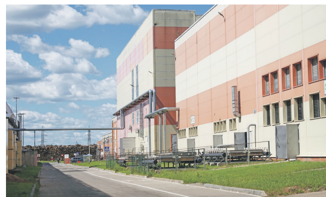
Материал подготовила Людмила СПИРИДОНОВА.