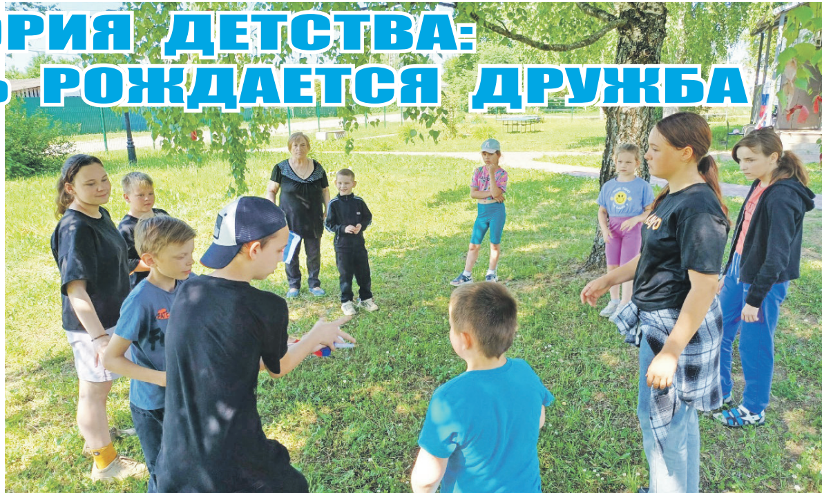
Игры на улице.