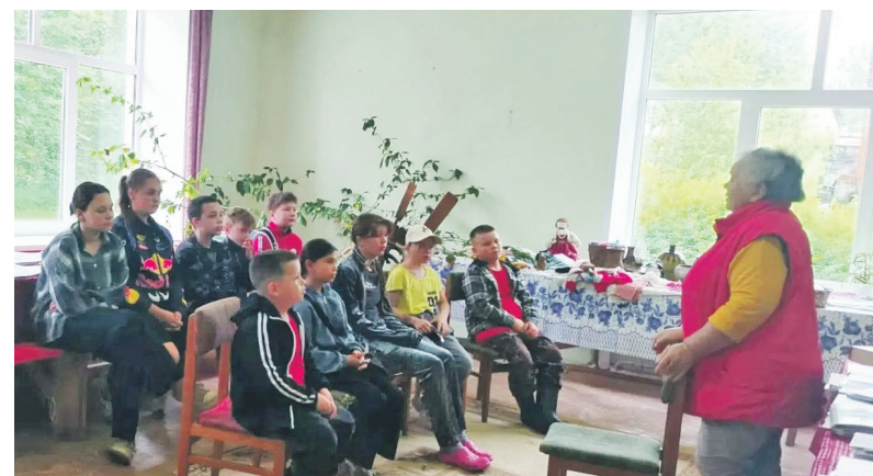
В музейной комнате.

Запомнится детям и День экологии. Они приняли участие в лечении дерева, а именно березки, смазали пораненные места садовым варом, а потом дружно навели порядок на территории у мемо-