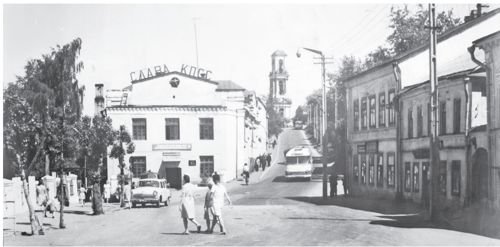
Улица Красная Гора.

ми и базировался на максимальном использовании существующих строительных коробок, а также с освоением местных строительных материалов. Руководство города определило задачи, которые необходимо было реализовать в кратчайшие сроки. Родилось новое движение по созданию добровольных трудовых бригад. Жители города отработали сотни часов на строительстве сверх основной работы. Многие объекты восстановлены исключительно руками населения. На восстановительных работах были активно задействованы школьники, студенты, домохозяйки.