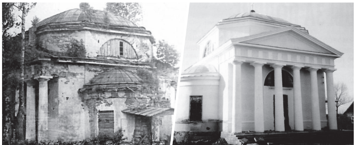
Храм в селе Арпачево до и после реставрации.