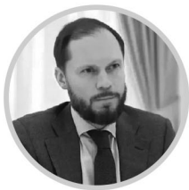
ВИТАЛИЙ КОРОЛЕВ врио Губернатора Тверской области

К участию в конкурсе ежегодно приглашают семьи, в которых воспитывается