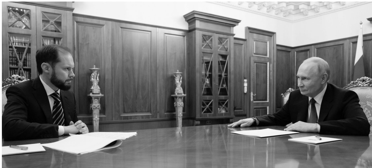
В.Г. Королёв на встрече с В.В. Путиным.

Виталий Геннадьевич Королёв назначен временно исполняющим обязанности губернатора Тверской области до вступления в должность лица, избранного главой региона. Соответствующий Указ подписал Президент Российской Федерации Владимир Путин.