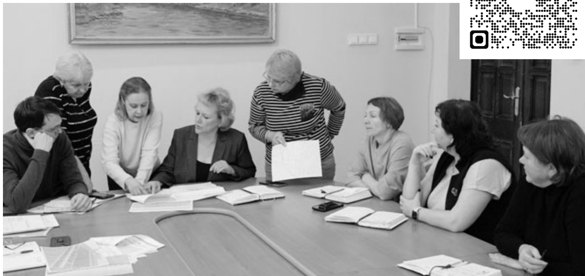
Во время обсуждения вопроса.