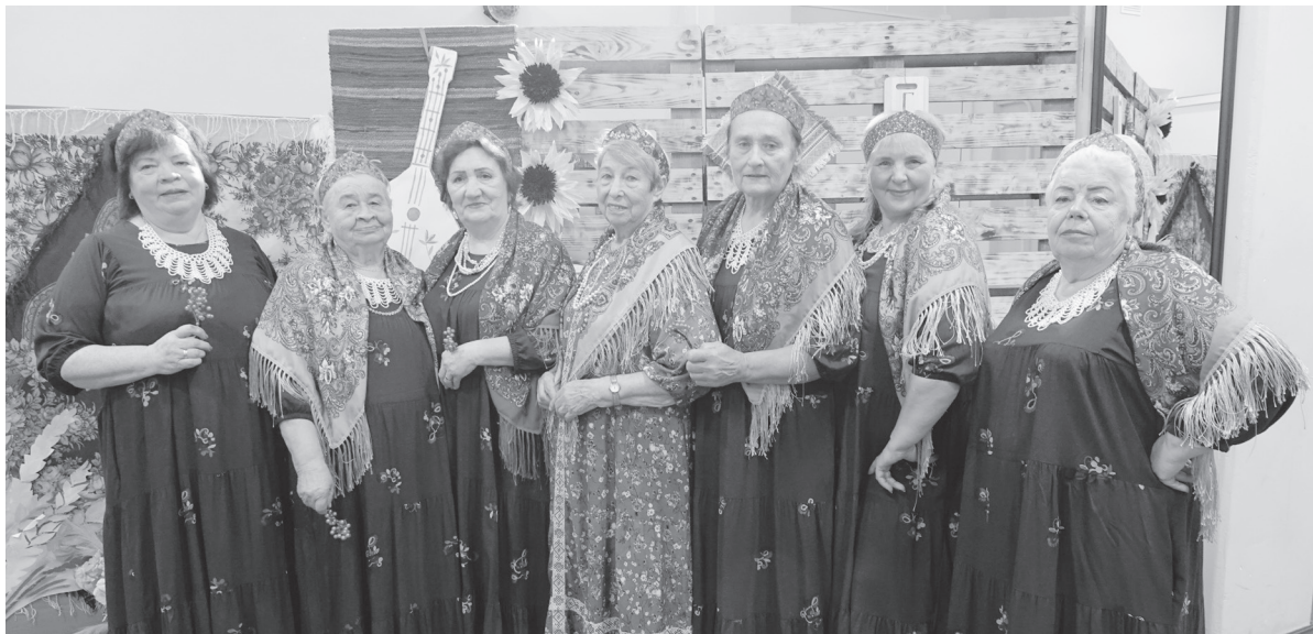
Участницы ансамбля «Жаленка».