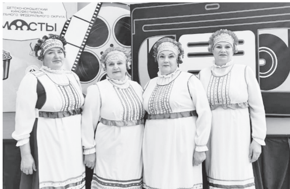
Вокальная группа «Парадокс».