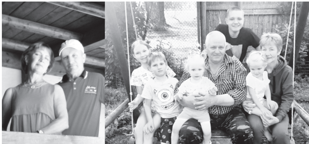
Участницы «Фантазии» с семьями.