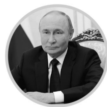
ВЛАДИМИР ПУТИН Президент Российской Федерации

В этом направлении уже идет активная работа. В рамках программы летней занятости на предприятиях отрасли нынче трудились более