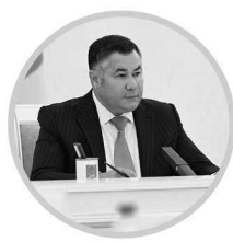
ИГОРЬ РУДЕНЯ Губернатор Тверской области

Реализуются комплексные промышленно-индустриальные проекты. В регионе со-