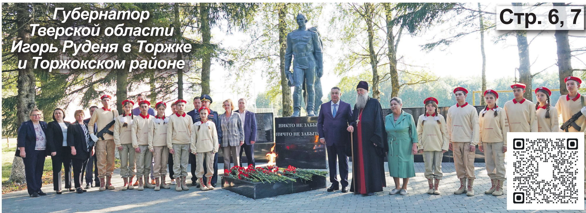
Губернатор Тверской области Игорь Руденя в Торжке и Торжокском районе