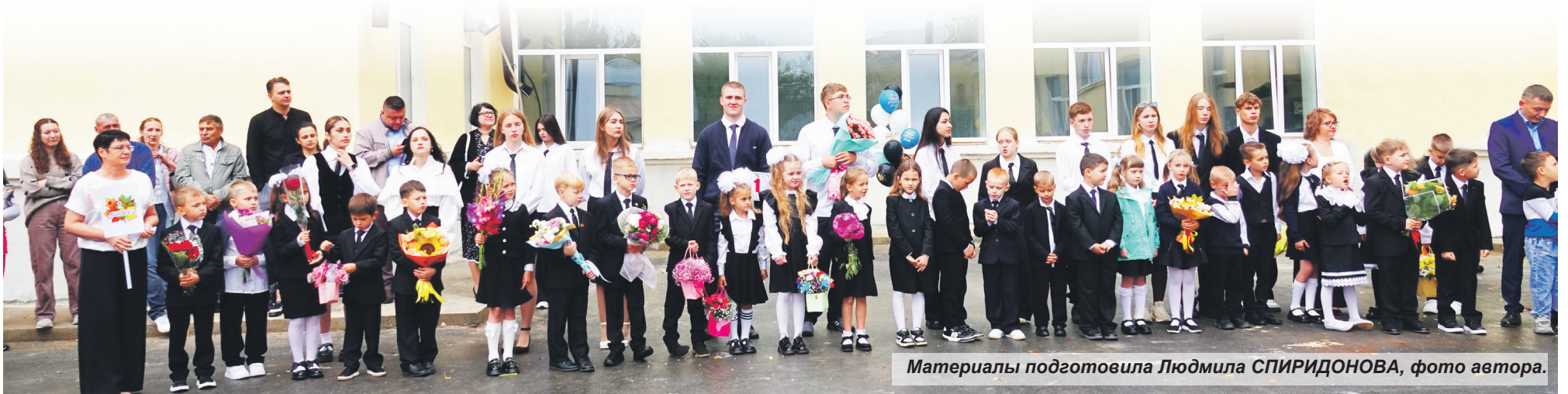
Материалы подготовила Людмила СПИРИДОНОВА, фото автора.