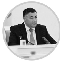
ИГОРЬ РУДЕНЯ Губернатор Тверской области

– Образование определяет будущее человека, региона, страны. Президент РФ это хорошо понимает. Если мы и дальше будем вкладываться в обра-