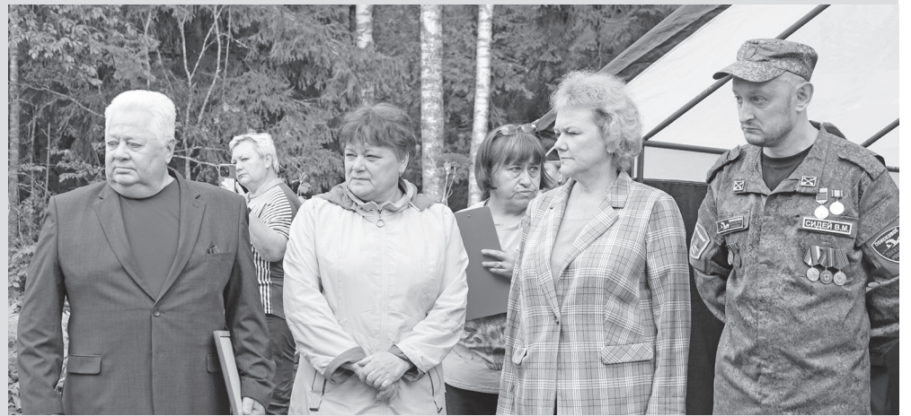
Участники траурного мероприятия.

На кордоне Гремячиха у села Страшевичи прошла церемония перезахоронения останков советских солдат, павших в Великой Отечественной войне 1941–1945 годов в Торжокском районе.