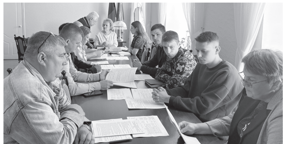
В ходе заседания комиссии.