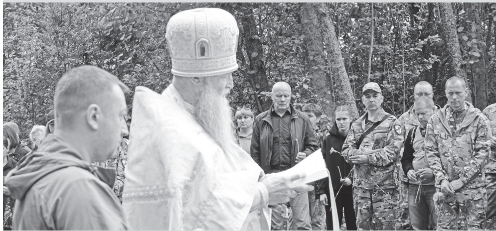
Во время панихиды.