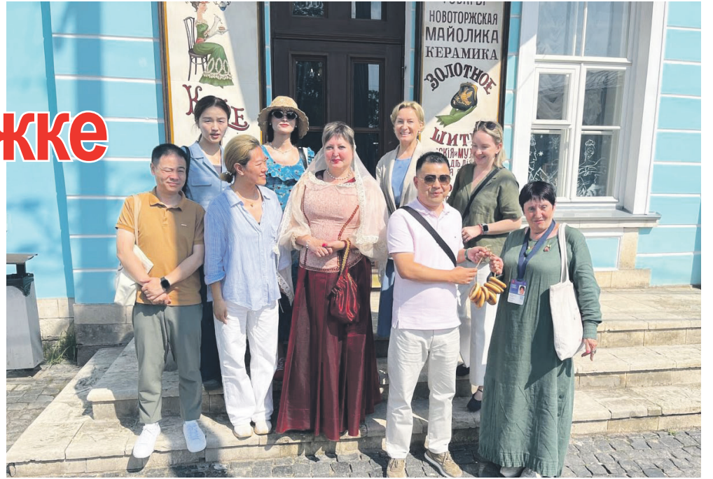
Гости из Китая в Гостинице Пожарских.

В нашем городе гости из Китая посетили Музей золотного шитья, объекты Всероссийского историко-этнографического музея (Го-