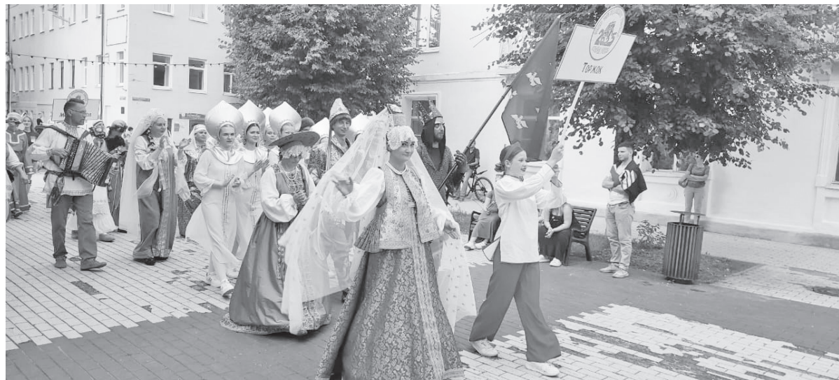
Делегация Торжка во время ганзейского шествия.

Выступления музейного театра «Петрушкина