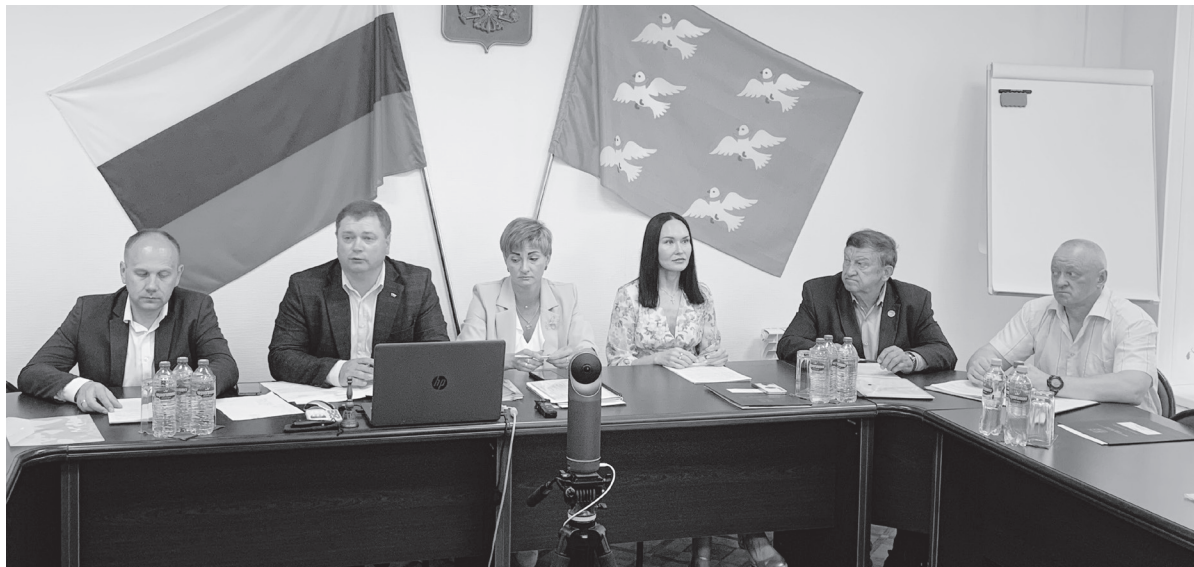
Во время обсуждения вопросов.