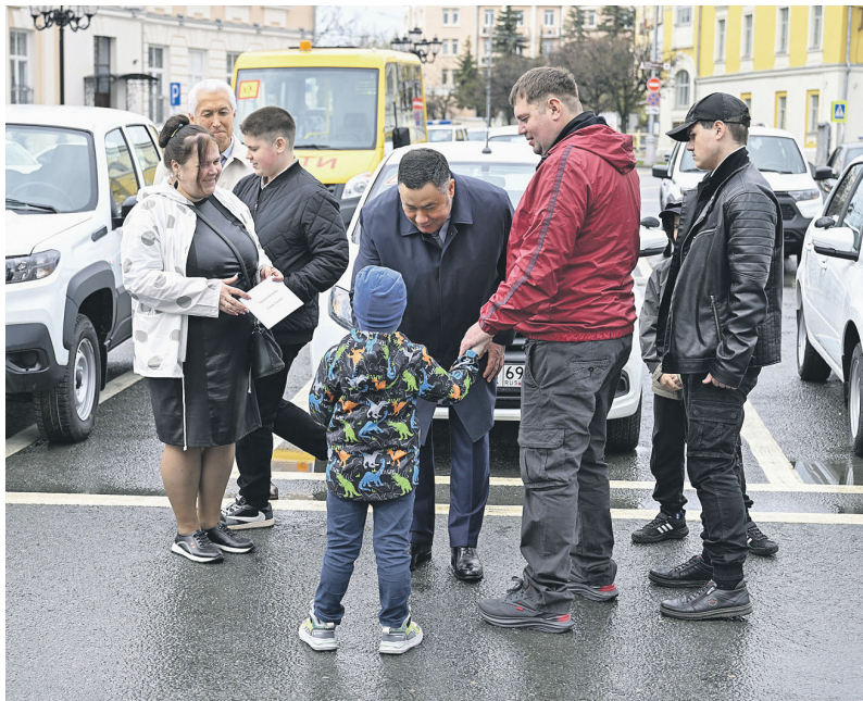
Глава региона И.М. Руденя вручает ключи от автомобилей многодетным семьям.

— Какие льготы гарантируются в связи с рождением и воспитанием детей?