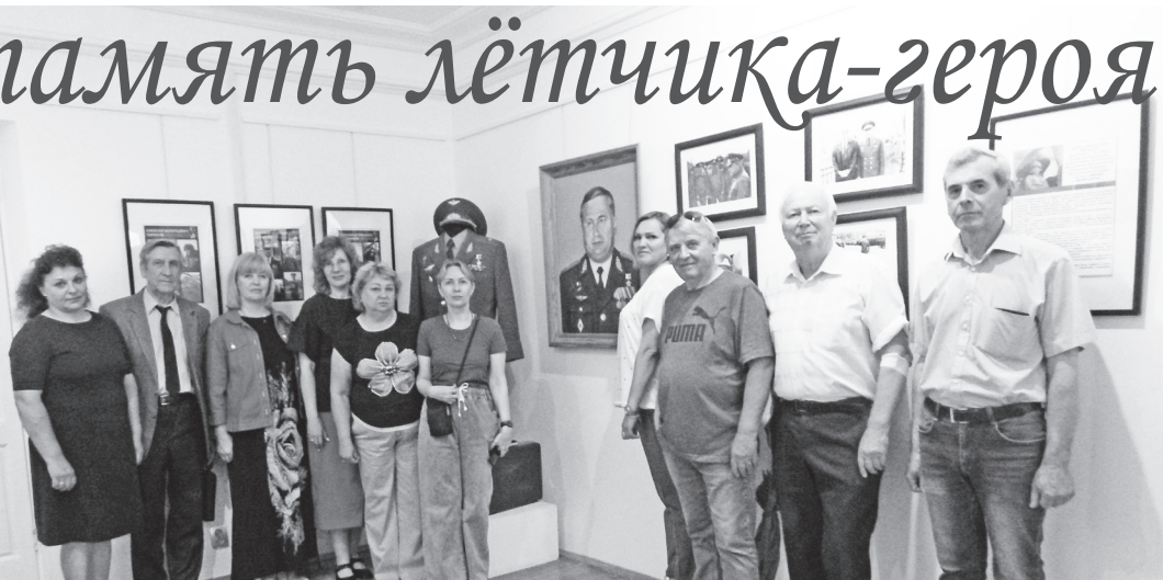
Участники встречи в ВИЭМ.