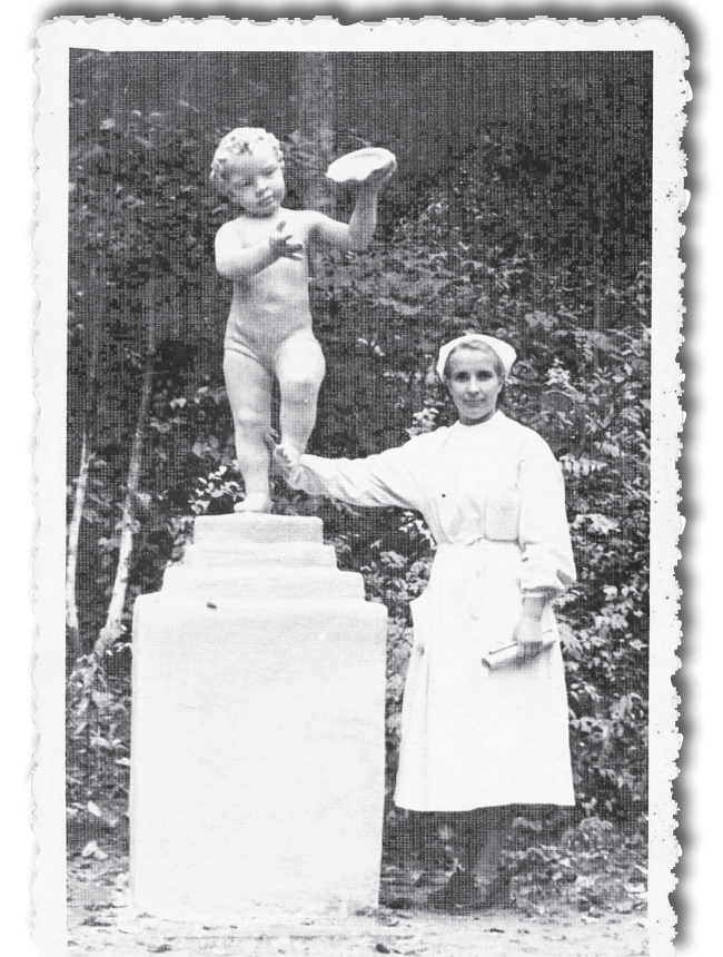
В молодые годы.