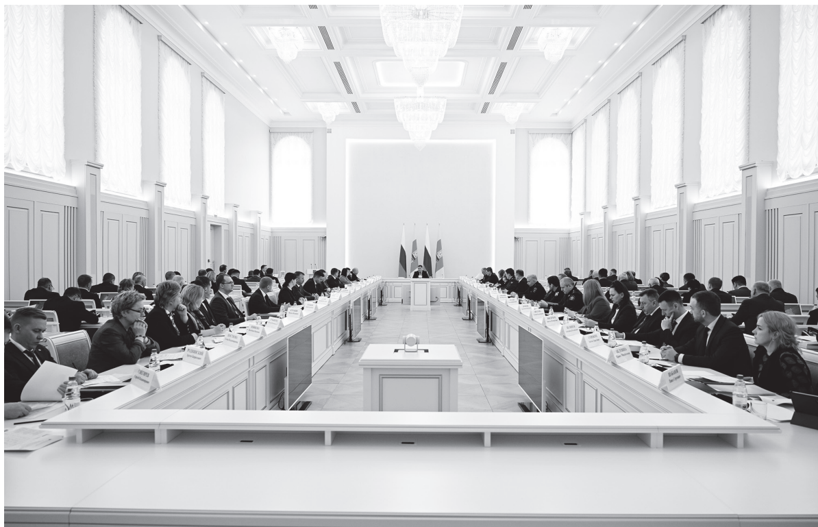
Заседание Правительства Тверской области.

Еще одно важное направление работы – усиление мероприятий по снижению технологических нарушений на электросетях. Так, разработан план в сфере энергетики, направленный на повышение надежности электроустановок компа-