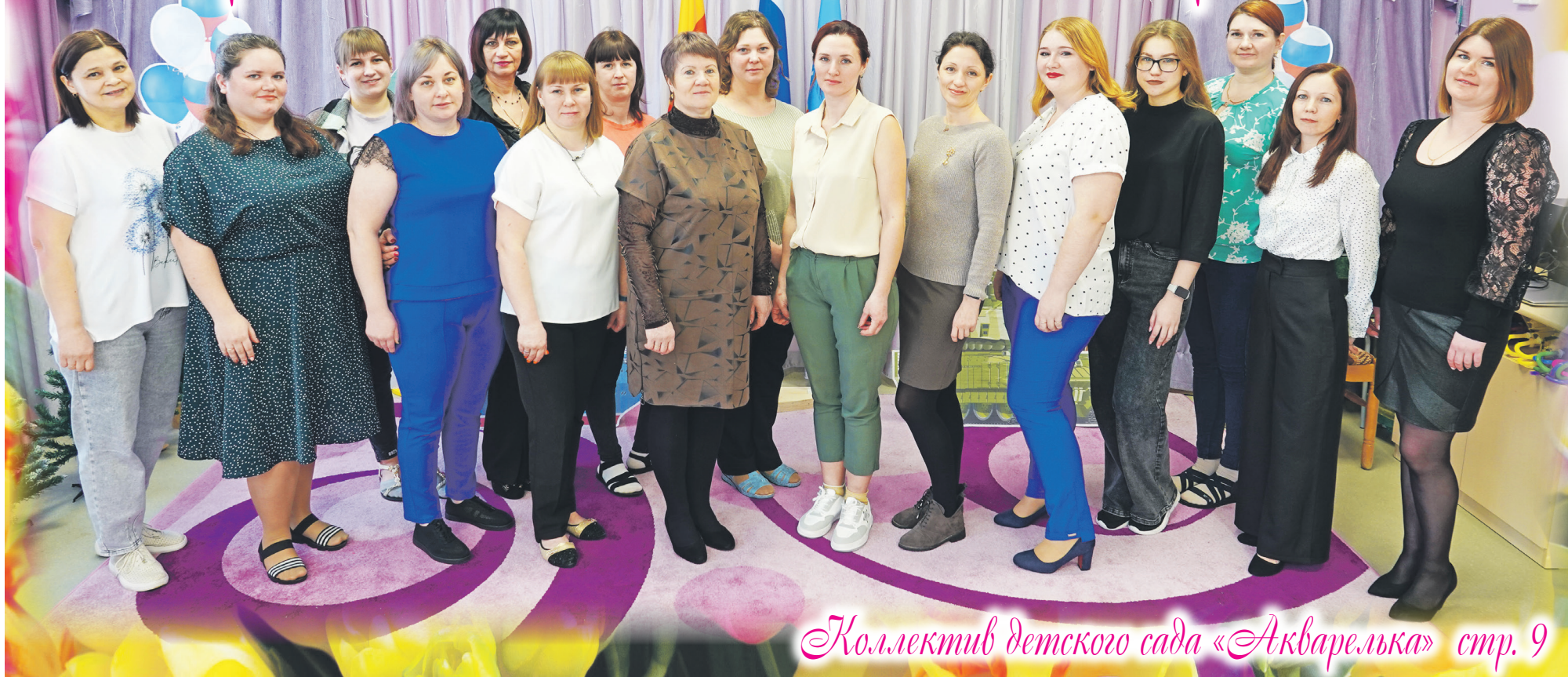
Коллектив детского сада «Акварелька» стр. 9