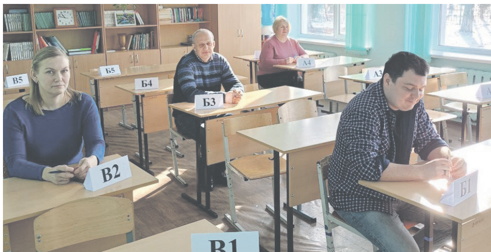
Родители заняли индивидуальные места в аудитории.