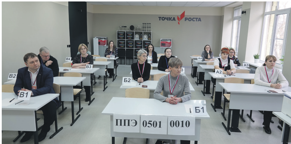
Участники акции в классе.