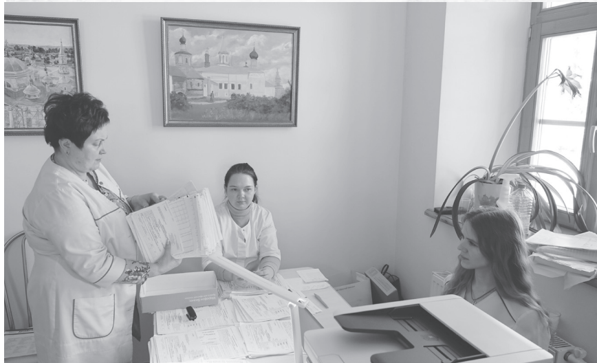
Специалисты областной больницы.

С 25 по 26 февраля на территории Новоторжского мужского Борисоглебского монастыря сотрудники Тверской областной клинической больницы проводили выездную диспансеризацию населения. Пройти обследования смогли около двухсот жителей города Торжка и Торжокского района.