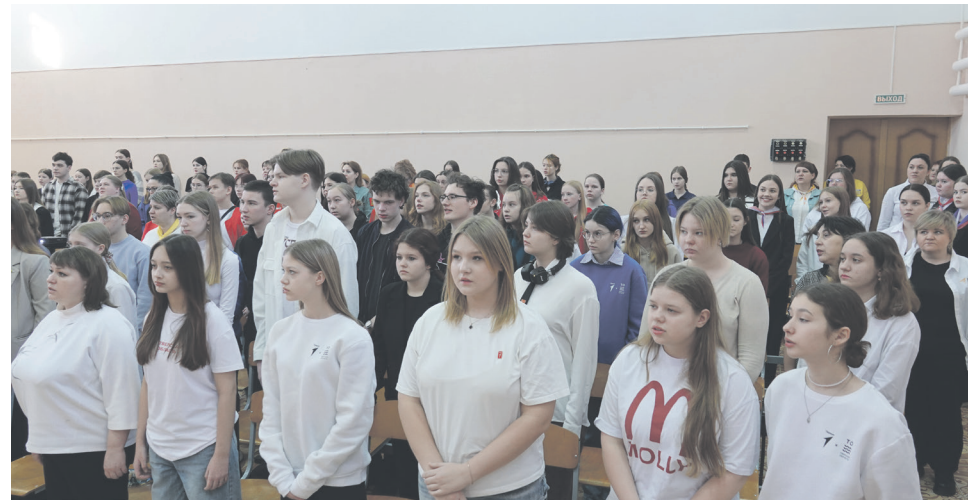
Ребята приехали из разных муниципалитетов.

Шестой межмуниципальный медиафорум собрал в Торжке активную молодежь из шести муниципальных образований Верхневолжья. Участниками стали активисты всероссийского Движения Первых из Осташковского, Кувшиновского, Лихославльского муниципальных округов, города Торжка и Торжокского района. Всех радушно встречали в средней школе №6, которая стала площадкой для проведения важного мероприятия.