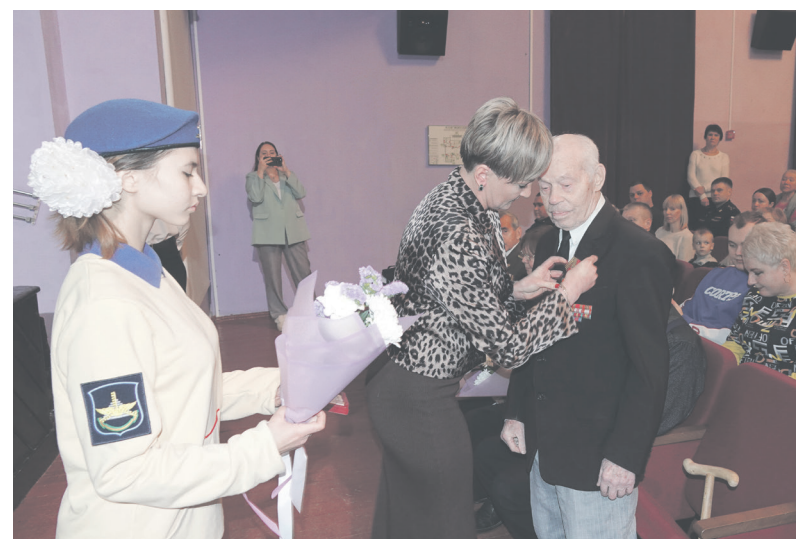
Вручение юбилейных медалей ветеранам.