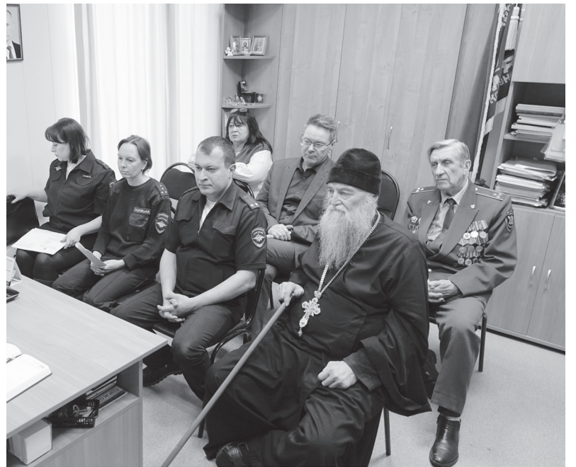
Заседание Общественного совета.

В ходе заседания сотрудники полиции ответили на вопросы