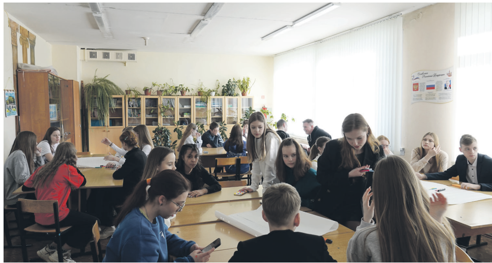
Юные медийщики подружились, обменялись идеями.