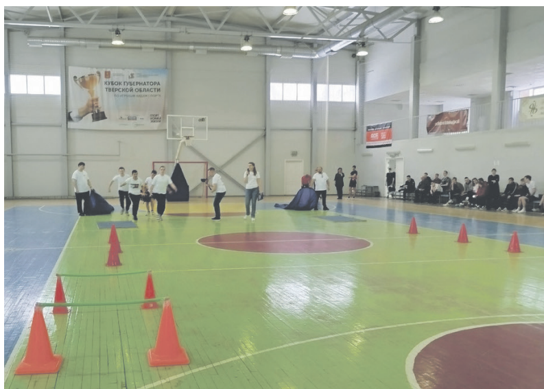
Прохождение полосы препятствий.