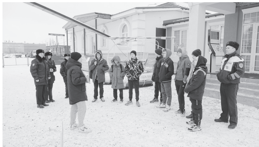
На территории музея.

Ребята познакомились с историей российской авиации и вертолетостроения, рассказали им об экспонатах музея. Мальчишки смогли посидеть в кабине пилота, попробовать свои силы на тренажере. В музее работает авиатренажер-симулятор. Он создан на базе вертолета Ми-2. Реалистичное исполнение модели симулятора полностью погружает в мир авиации.