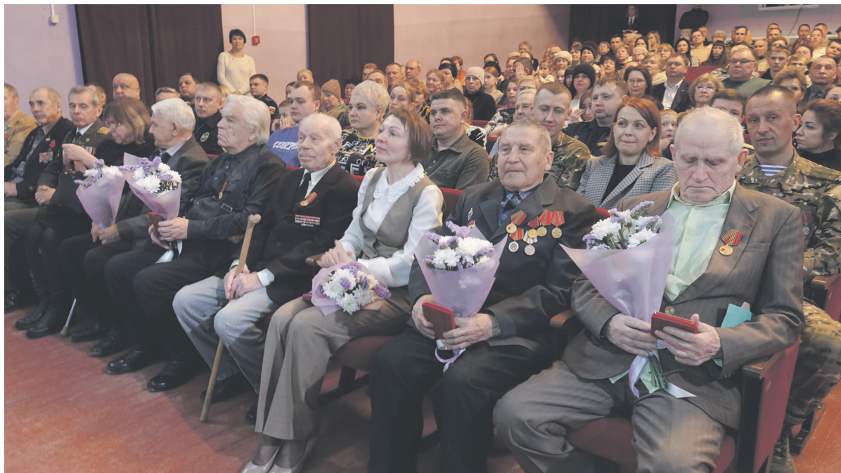
В числе почетных гостей – представители старшего поколения.

В День защитника Отечества в городском Доме культуры прошли торжественное собрание и праздничный концерт. В этот день по доброй традиции чествовали ветеранов Великой Отечественной войны, военнослужащих, ветеранов боевых действий и участников СВО, сотрудников правоохранительных органов, МЧС, УФСИН, вневедомственной охраны, представителей муниципальных служб.