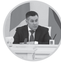
ИГОРЬ РУДЕНЯ Губернатор Тверской области

В Верхневолжье будут действовать системы мониторинга обстановки в лесах: наземное патрулирование, спутниковый и авиационный мониторинг (в том числе с помощью беспилотных авиасистем), видеонаблюдение посредством установленных на вышках сотовой связи 157 видеокамер. Видеонаблюдением охвачено 98 процентов лесного фонда Тверской области, эта система в Верхневолжье наряду с Московской областью – одна из самых крупных в ЦФО. Мониторинг пожароопасной обстановки будет вестись также на участках торфоразработок и в охотничьих угодьях.