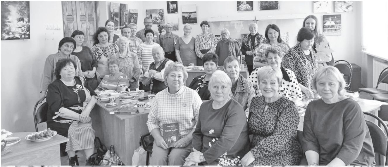
На творческом мероприятии.