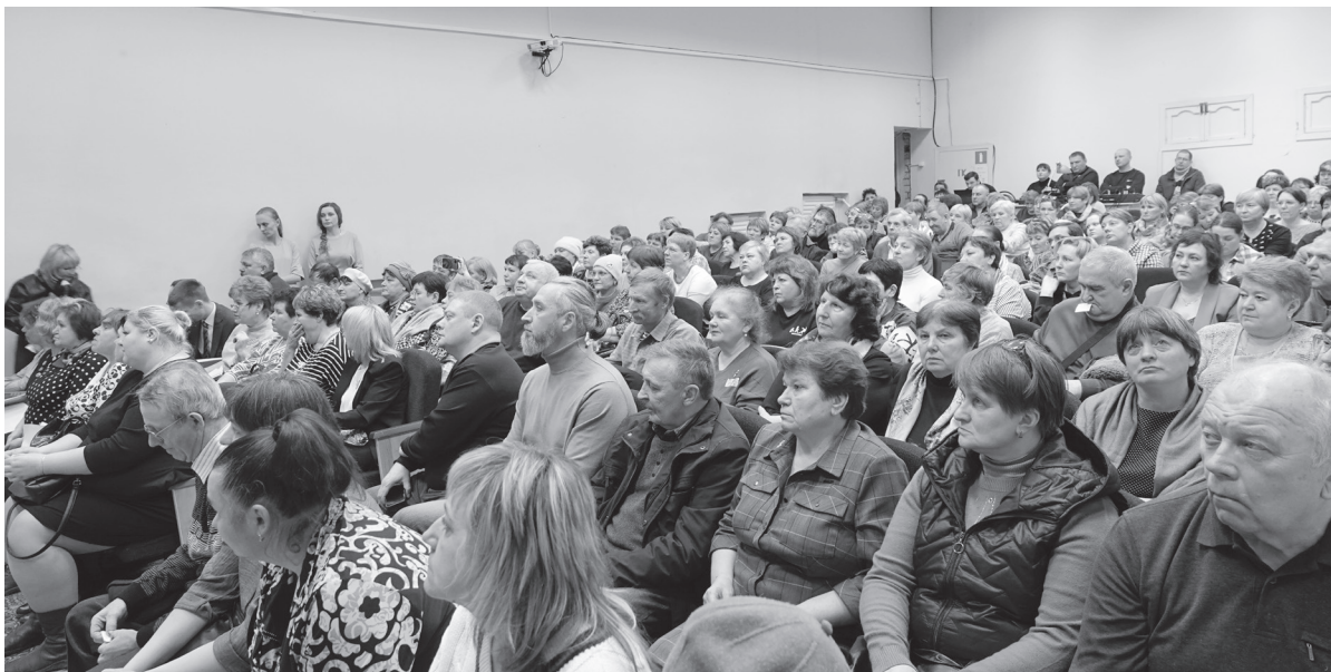
На публичных слушаниях.

В Торжокском районе 14 марта в МБУК «Информационно-методический центр» прошли публичные слушания по преобразованию всех поселений, входящих в состав Торжокского муниципального района Тверской области, путем их объединения с наделением вновь образованного муниципального образования статусом муниципального округа.