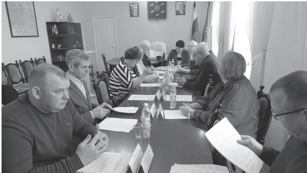
Во время заседания.