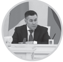
ИГОРЬ РУДЕНЯ Губернатор Тверской области

Региональные власти и муниципалитеты в пожароопасный сезон предпринимают комплекс мер для защиты населения и лесов