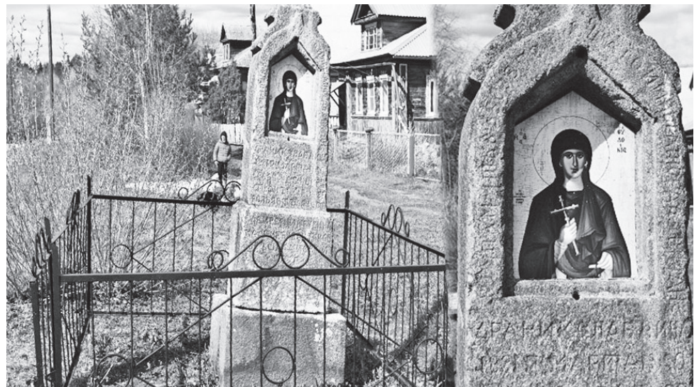
Часовня св. прмц. Евдокии в Трубине.