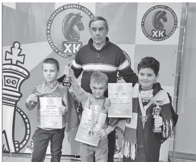
Победители турниров получают кубки, медали, грамоты.