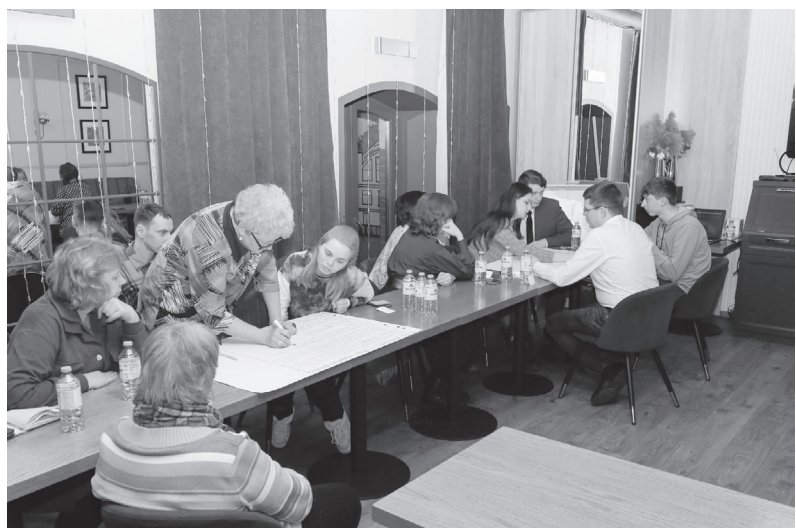
В ходе встречи.