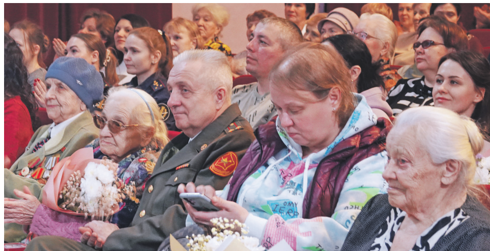
Торжество объединило женщин разных поколений.