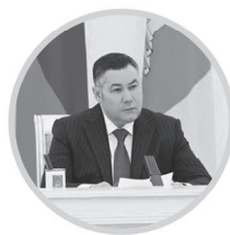
ИГОРЬ РУДЕНЯ Губернатор Тверской области

Событиями международного масштаба станут экспедиция «Ржев. Калининский фронт», Вахта памяти «Бельский плац-