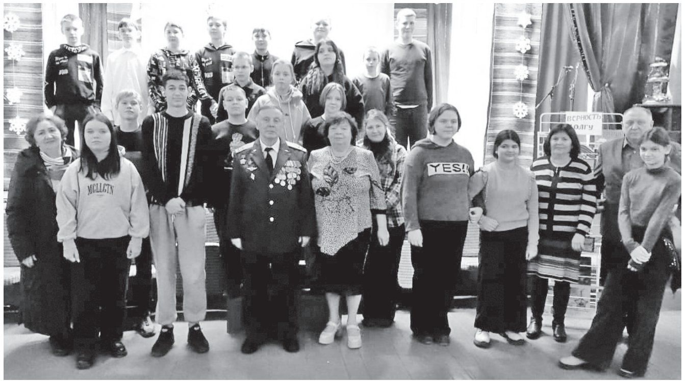
На встрече в Грузинах.

В Ладьино оформлена тематическая выставка «Память пылающих лет», работники культуры приняли активное участие во Всероссийской акции «Блокадная ласточка» и «Блокадный хлеб». Проведен час мужества «Солдатский долг исполнив свято, мы отстояли Сталинград». А в День памяти и скорби здесь будет организован велопробег по местам боевой славы «Замедли шаг у обелисков».