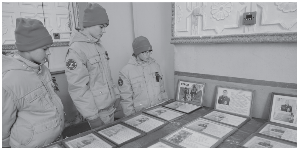
Выставка рассказывает о героях СВО.

— Мы сегодня отдаем дань памяти и уважения каждому, кто приближал и обеспечивал Великую Победу. В преддверии Дня защитника Отечества хочу особо отметить, что мы должны помнить о великом подвиге отцов и дедов. Игра «Зарница» помогает сплотить командный дух, показать лучшие спортивные результаты и взаимовыручку.