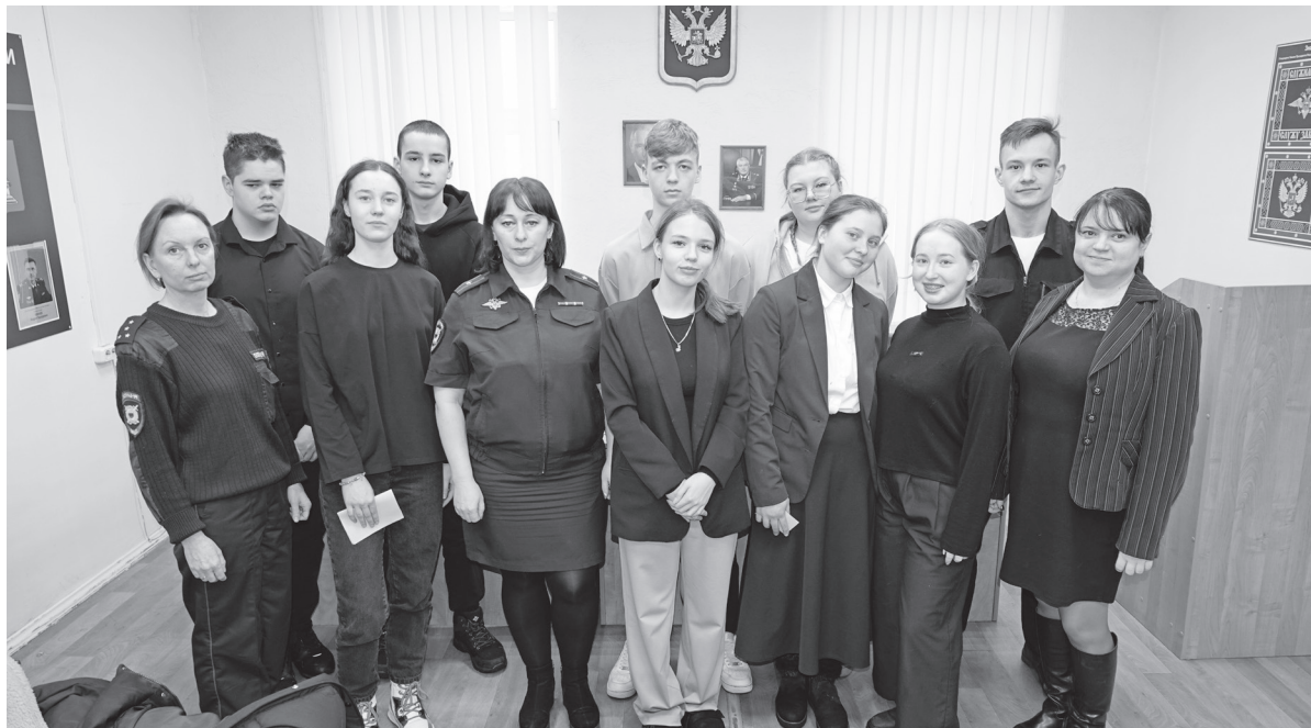
Старшеклассники со стражами порядка.

Специалист направления профессиональной под-