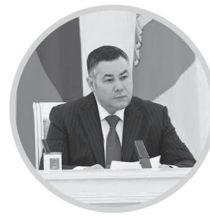
ИГОРЬ РУДЕНЯ Губернатор Тверской области

Поставлены задачи по совершенствованию работы в сфере госзакупок со стороны муниципалитетов, увеличению доли тверских предприятий и организаций в поставках товаров и услуг.