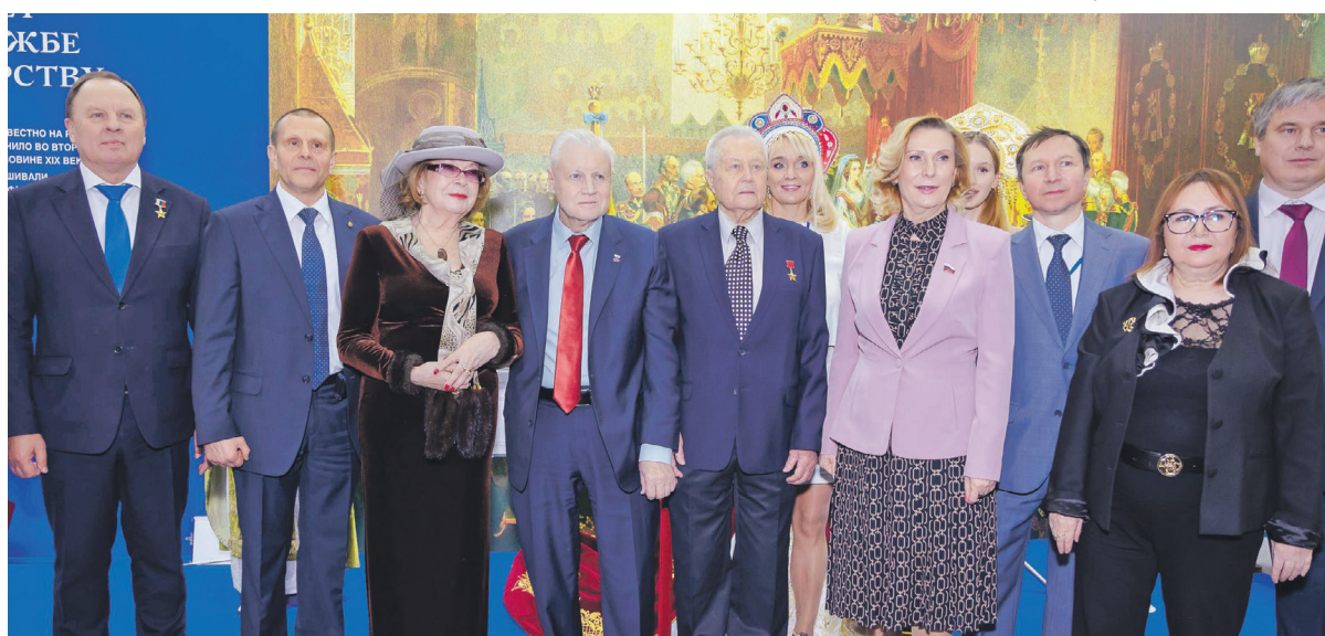
Почетные гости у стенда «Торжковских золотошвей».

Выставка «Уникальная Россия», транслирующая глубокие и многогранные смыслы, будет проходить в «Гостином дворе» до 9 февраля. В программе – культурные мероприятия, конкурсы, показы одежды и др. Таким образом, жители Тверской области могут успеть посетить экспозицию «Торжковских золотошвей» и проникнуться гордостью за родной край и, следовательно, за всю Россию! По старинной традиции на таком мероприятии возможно и людей посмотреть, и себя показать.