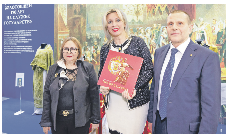
Пресс-атташе МИД РФ прибыла на выставку «Уникальная Россия», чтобы полюбоваться произведениями «Торжковских золотошвей». Мария Захарова порекомендовала всем посетить Торжок в Тверской области.

– На эту выставку мы привезли часть нашего музея. Представлен-