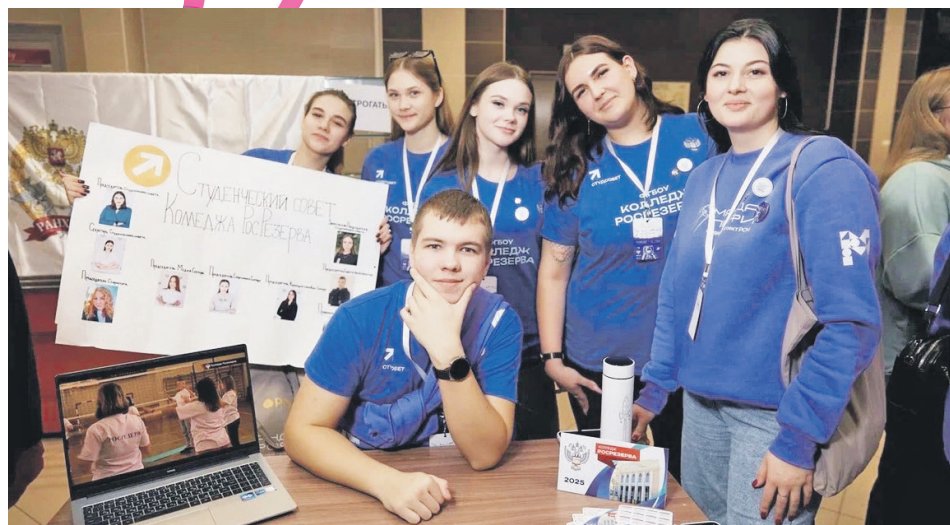
Команда колледжа Росрезерва на чемпионате.

«Совсем недавно студенческий совет участвовал в чемпионате по студенческому самоуправлению в СПО в великом историческом городе, в Казани. Я была поражена масштабами этого мероприятия. Царила дружеская и, главное, творческая атмосфера. Я познакомилась с большим количеством единомышленников как в плане работы студсовета, так и в жизни. Мы много общались, и я буду общаться дальше. Спасибо «Команде ПРОФИ» за вложенное старание и спасибо колледжу за возможность участия в чемпионате. Это был незабываемый опыт!»