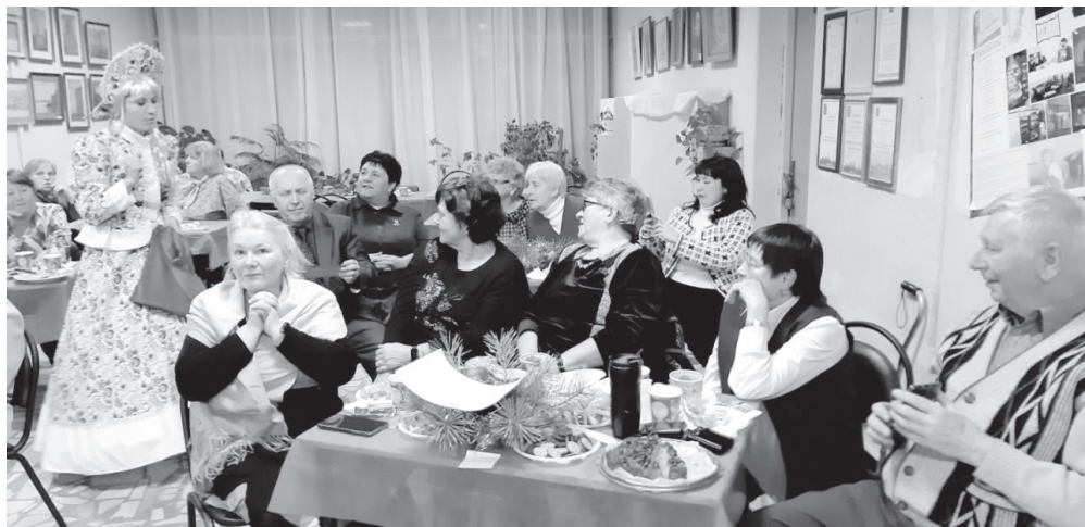
Встреча прошла в теплой, душевной обстановке.

В Центральной городской библиотеке им. В.Ф. Кашковой прошел новогодний голубой огонек «Это наша семья», посвященный Году семьи.