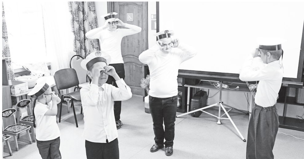
Ребята подготовили концертную программу.