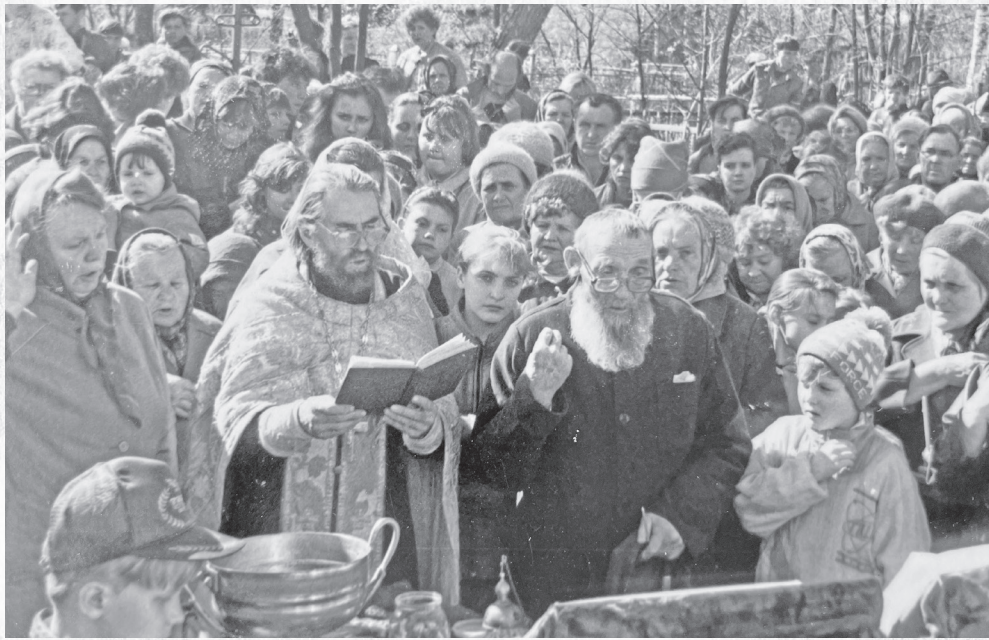
7 мая 1994г. Молебен и установка первого креста на колокольню.