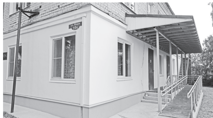
Обновленный первый этаж здания.

Людмила СПИРИДОНОВА.