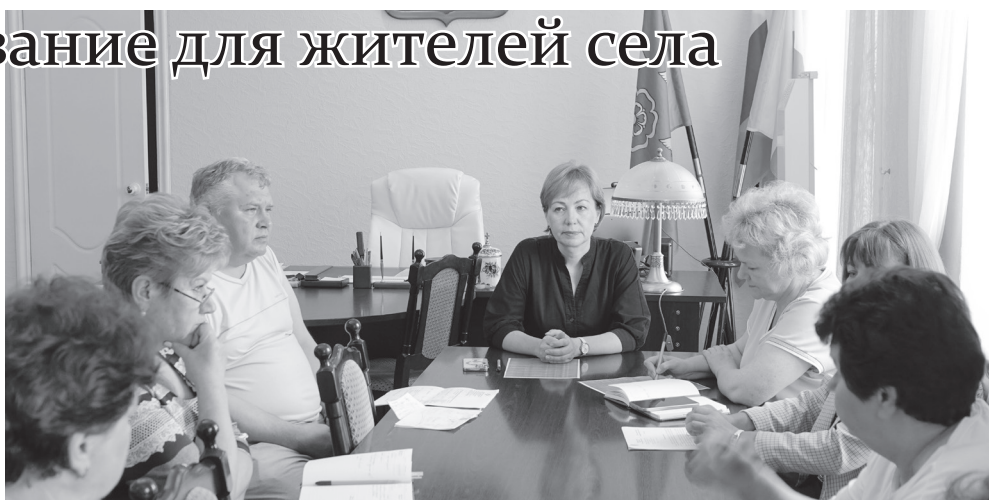
Во время совещания.