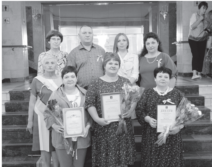
Новоторы с наградами.

Губернатор Тверской области И.М. РУДЕНЯ.