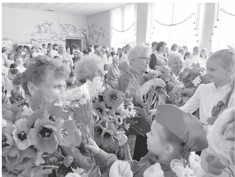
Цветы – почетным гостям.

В городских школах Торжка прошли торжественные мероприятия и праздничные концерты, посвященные Дню Победы.