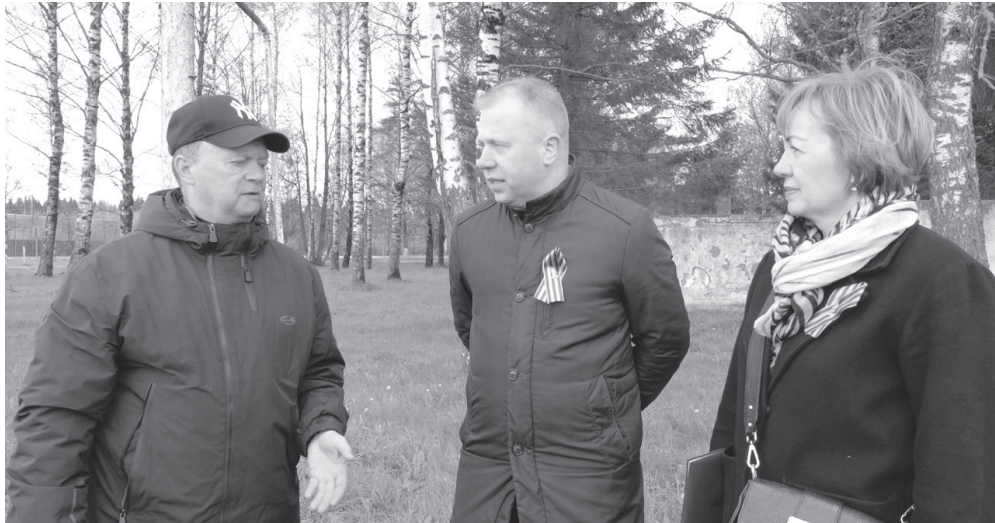
Во время разговора с руководителем ФК «Урожай».