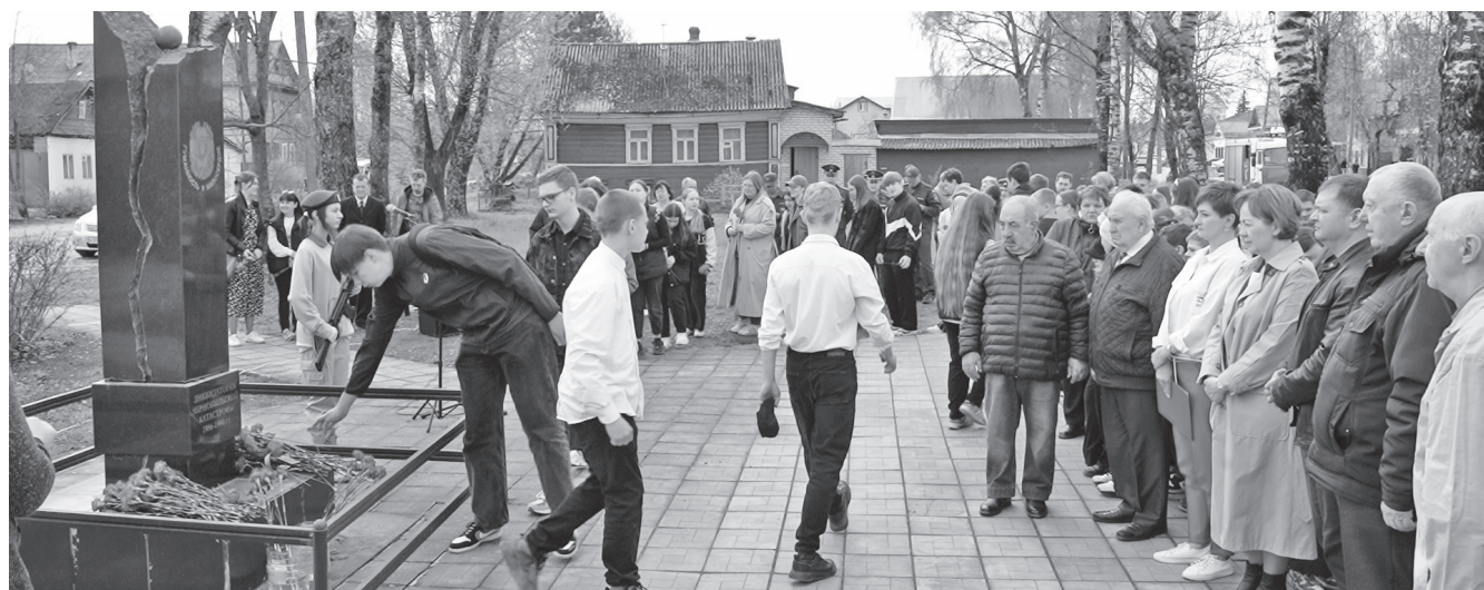
Во время митинга.

В День участников ликвидации последствий радиационных аварий и катастроф и памяти их жертв в Торжке прошел митинг. У памятной стелы собрались представители власти и общественности, ликвидаторы последствий аварии на Чернобыльской АЭС, военнослужащие, сотрудники МЧС, ветераны, а также школьники и юнармейцы.