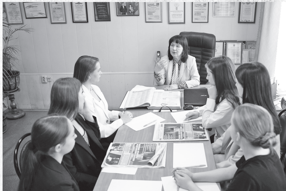
В редакции газеты.