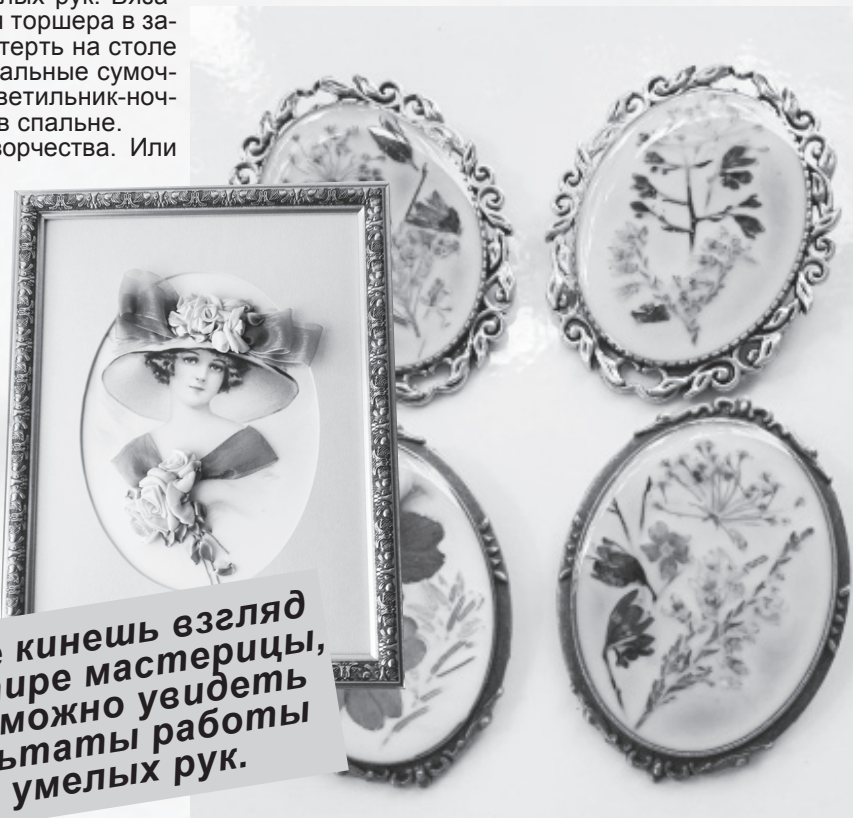
Броши ручной работы.

Куда не кинешь взгляд в квартире мастерицы, везде можно увидеть результаты работы ее умелых рук.