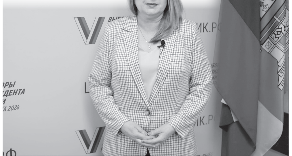
Председатель Избирательной комиссии Тверской области В.Е. Дронова.

Напомню, что у нас огромное количество именно сельских населенных пунктов, в которых проживает и один, и два, и три избирателя, где-то и 25–50 человек, но многие из них настолько удалены от центра избирательного участка, что можно назвать любой такой населенный пункт труднодоступным. Избирательные комиссии будут организовывать в населенных пунктах, удаленных от избирательных участ-