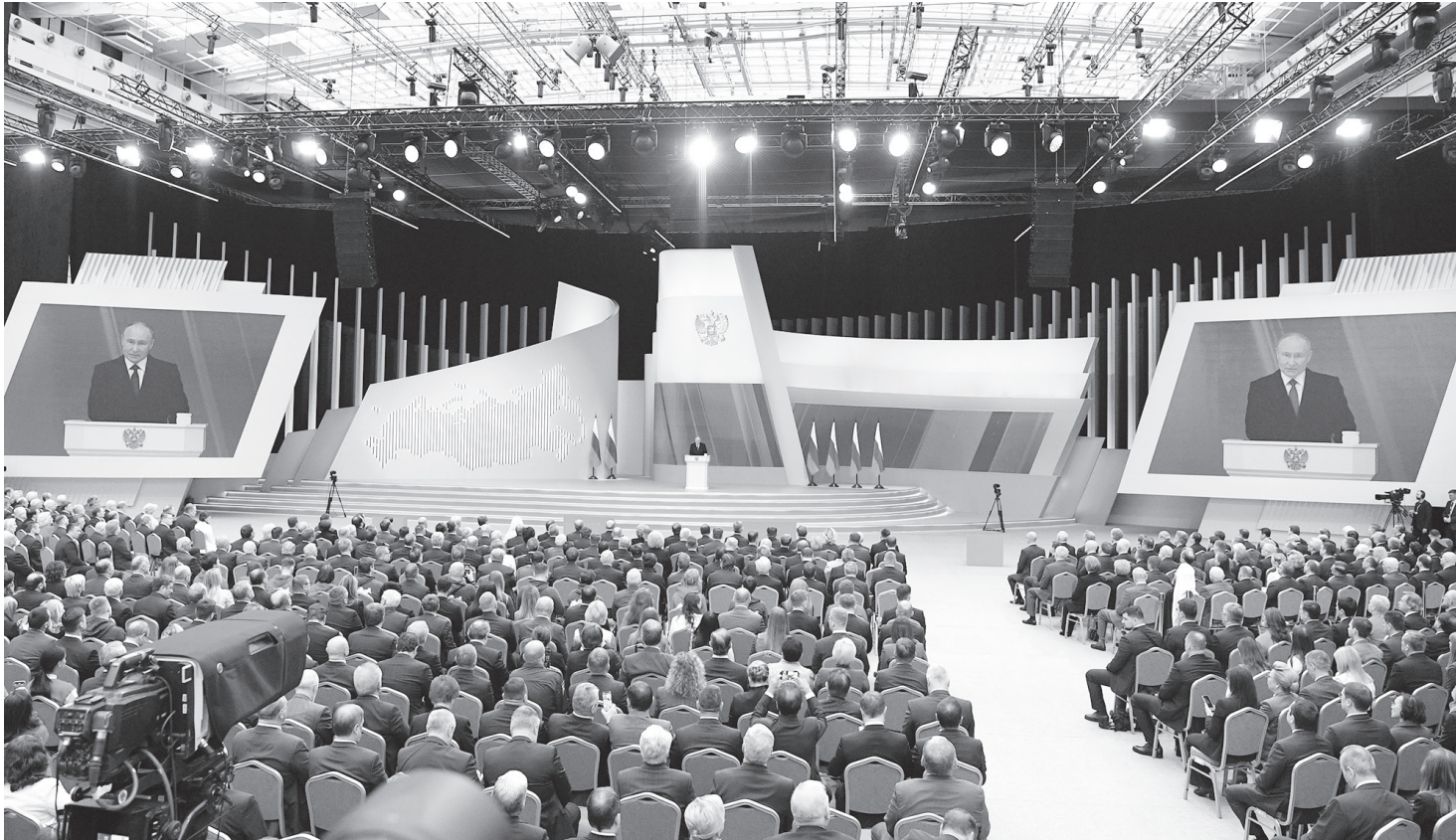
Выступает Владимир Путин.

Президент России Владимир Путин 29 февраля выступил с Посланием Федеральному Собранию РФ. В мероприятии принял участие губернатор Тверской области Игорь Руденя.