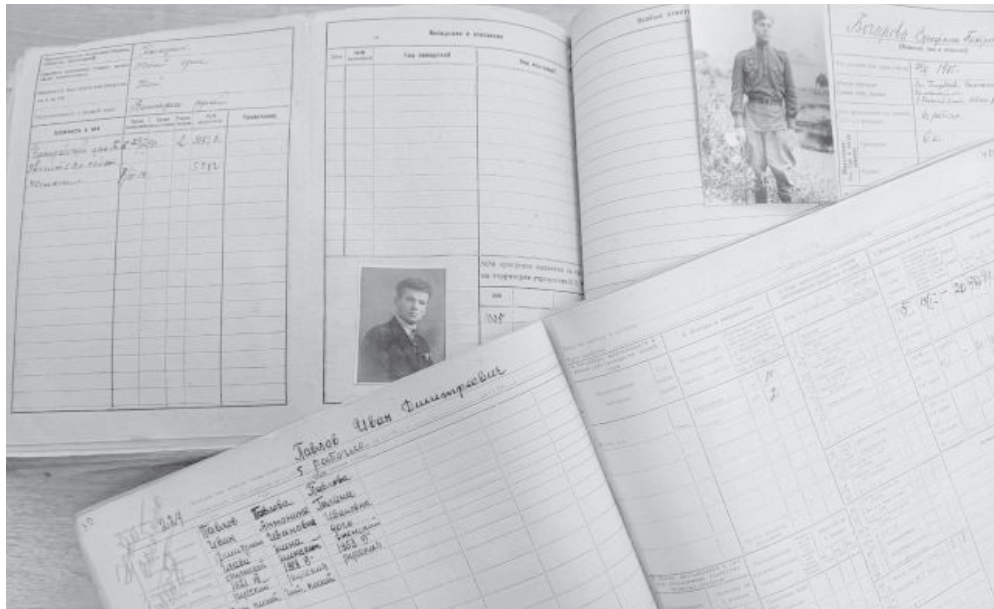
Новые сведения о близких – бесценный подарок для потомков.

Круг источников для поиска генеалогических сведений достаточно велик. В метрических книгах каждой церкви фиксировались браки, рождения и смерти. Ревизские сказки представляли собой переписи податного населения, которые с 1719 по 1858 г. проводились 10 раз. Итоги первых трех переписей практически не по-