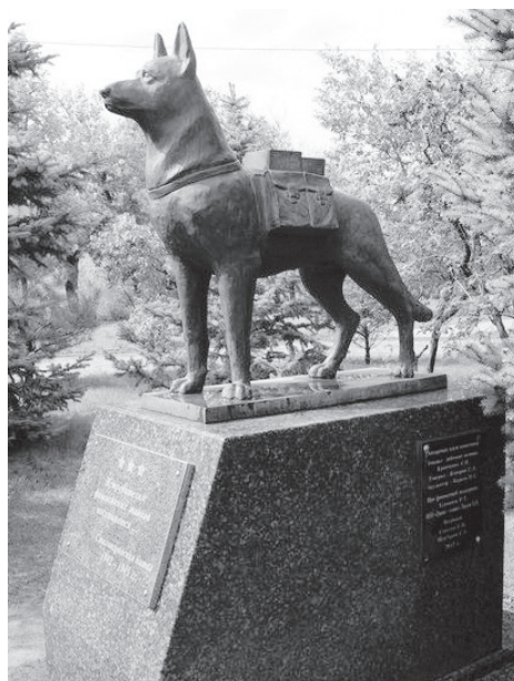
Памятник собакам-подрывникам в Волгограде.

И вот, спустя столько лет, я разглядываю самый старый семейный фотоальбом и все больше замечаю поразительное сходство старой Тузки и памятника собакам-подрывникам в Волгограде. Этот памятник я увидел на страницах интернета, когда искал архивные фотографии Альмы. На это ушло очень много времени, но я радовался, когда мои усилия увенчались успехом и я нашел фото собаки-подрывника на учениях. Она походила и на Тузку, и на памятник. Я очень надеялся, что время потрачено не зря. Я хотел получить подтверждение своим догадкам. Я хотел верить, что это Альма.