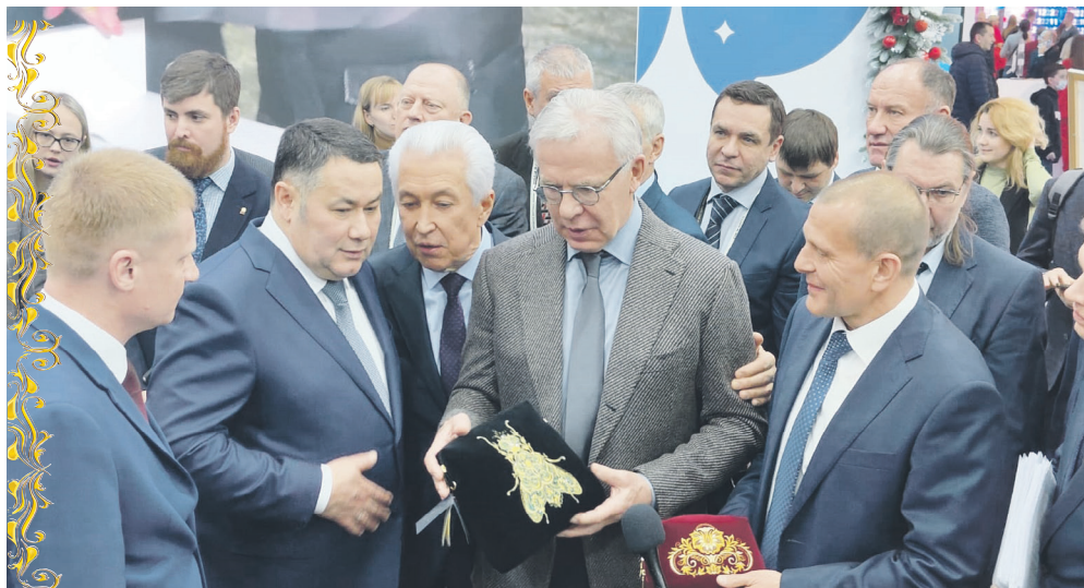
«Торжокские золотошвей» – бренд Верхневолжья.

– Замечательные впечатления от выставки. У нас много такого, чего еще нет у наших конкурентов. Мы видим, как успешно в регионе решаются все поставленные задачи. Мы гордимся