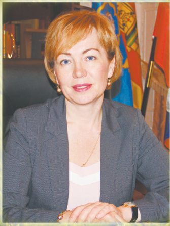
Глава Торжокского района Е.В. ХОХЛОВА.