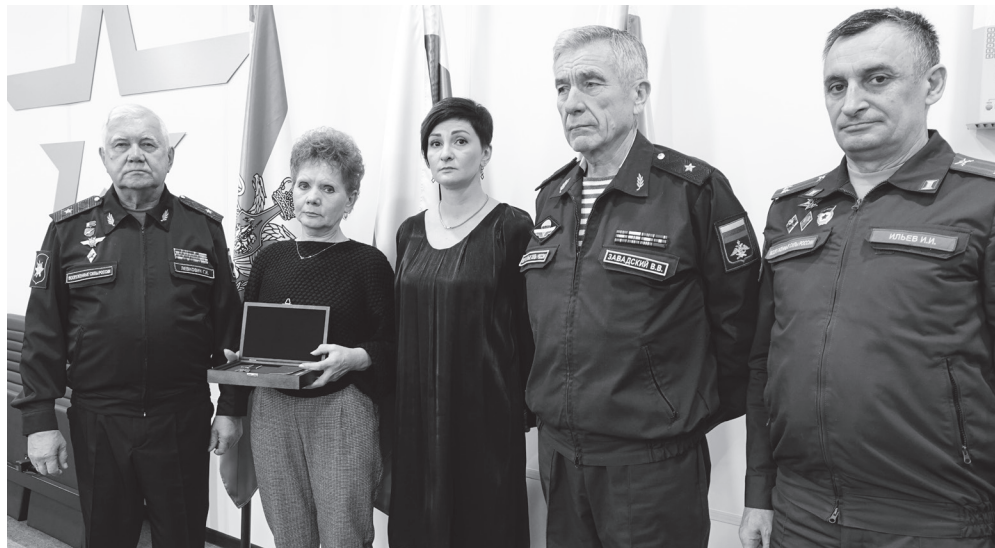
Награды передали семьям героев СВО.