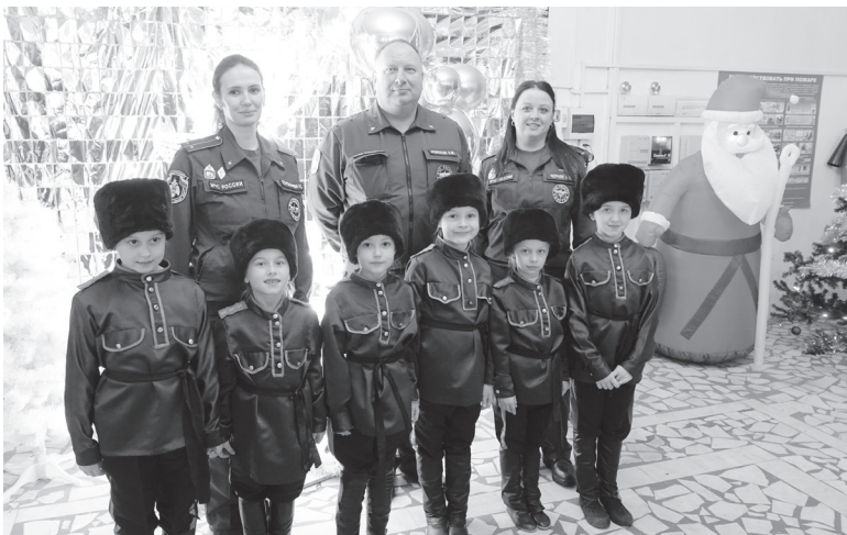
Сотрудники МЧС с юными артистами.

В городском Доме культуры прошло праздничное мероприятие, посвященное Дню спасателя. Поздравления и слова благодарности за нелегкую службу принимали сотрудники пожарно-спасательных частей и подразделений Торжка и Торжокского района, Кувшиновского муниципального округа, аварийно-спасательного отряда нашего города, работники муниципальных единых дежурно-диспетчерских служб, ветераны пожарной охраны.