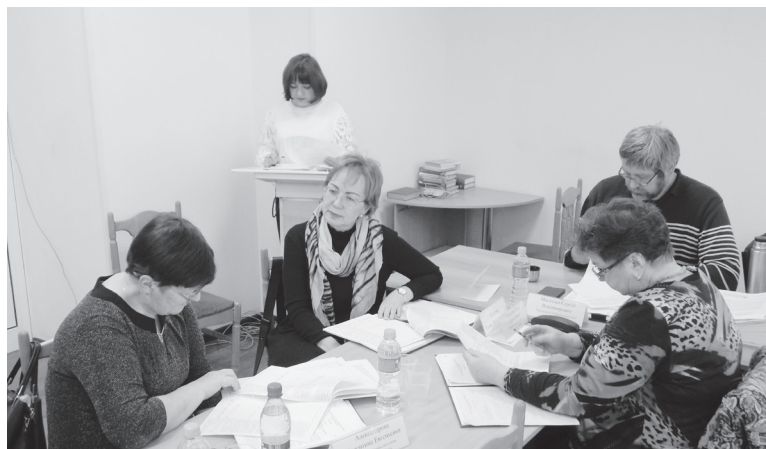
Во время заседания Собрании депутатов района.