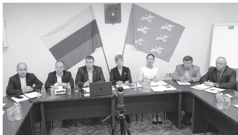
На заседании городской Думы.

Одним из главных вопросов стало рассмотрение проекта бюджета муниципального образования город Торжок на 2024 год и на плановый 2025 и 2026 годов. Ранее он прошел обсуждение на публичных слушаниях. Главный финансовый документ по-прежнему остается социально ориентированным. При формировании его расходной части учтены повышение МРОТ с 1 января 2024 года, повышение заработной платы работникам бюджетной сферы с 1 октября 2024 года, проиндексированы расходы на питание детей в дошкольных учреждениях. Планируются расходы на реализацию ряда национальных проектов. Депутаты обсудили и утвердили проект бюджета муниципалитета. Его основные параметры озвучила начальник управления финансов городской адми-