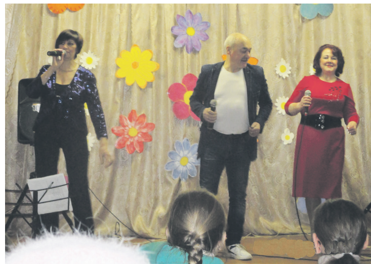
Гости на сцене.