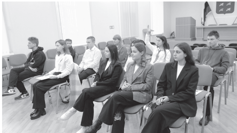
Местные активисты молодежного движения.

На заседании определили делегатов от города Торжка