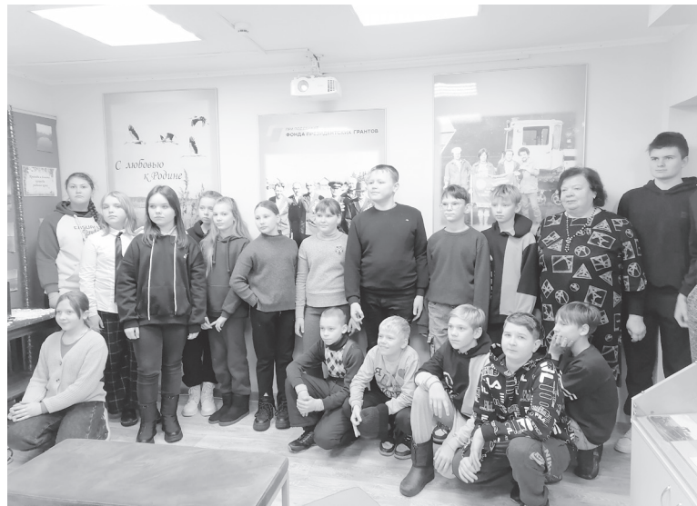
В музейной комнате школьники из Грузии.

В рамках реализации проекта «Сохраняем будущее села» при поддержке фонда Президентских грантов РФ учащиеся Грузинской основной школы посетили музейную комнату «С любовью к Родине» в п. Красный Торфяник.