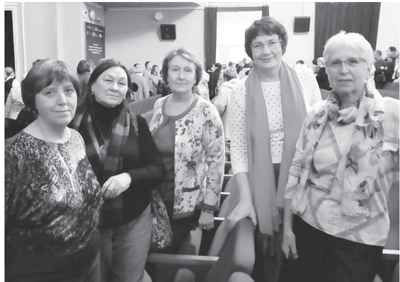
Участницы группы «Спас за Победу».