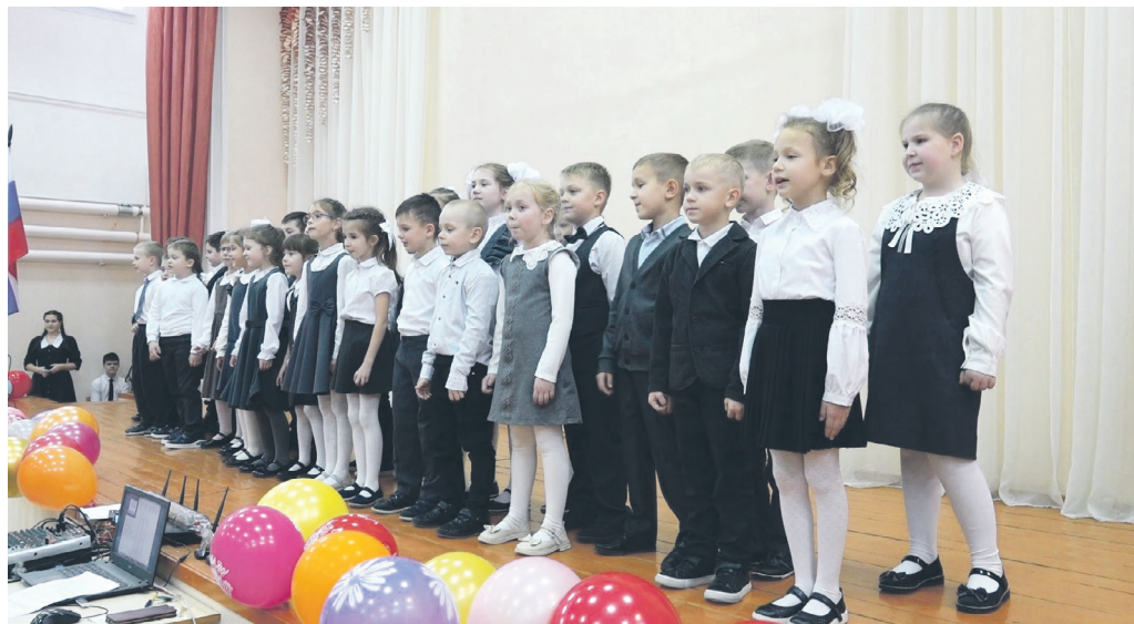
Творческий подарок от детей.