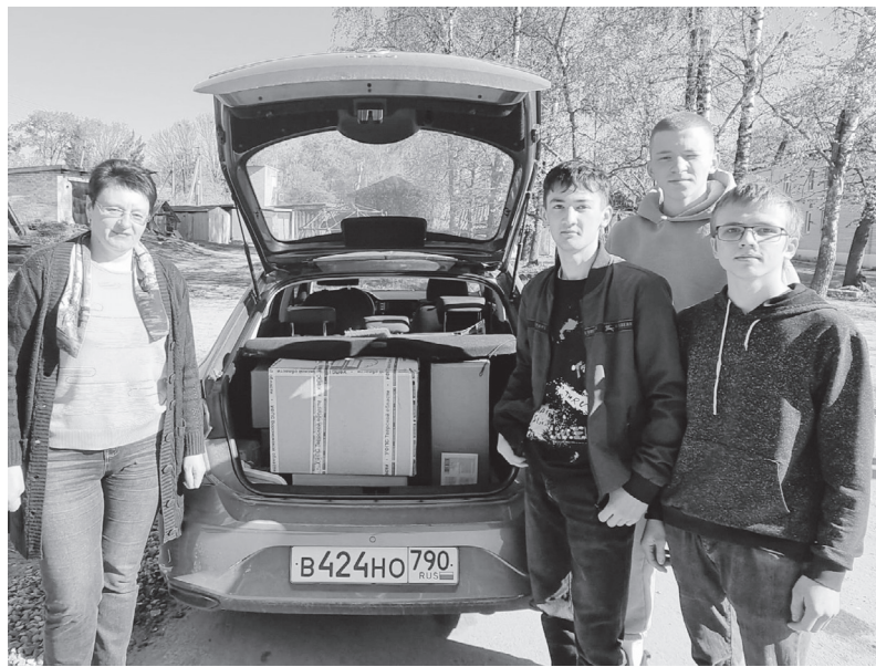
Помощь от учеников и педагогов Мирновской школы.

– Сегодня в отношении к Господу, к молитве во многом свой отпечаток наложила секуляризация: то есть вроде как человек внешне верующий, но он все же надеется на все что угодно, например, на современные технологии, но только не полагается на Бога, – отметил настоятель. – Всевышний у человека современного не