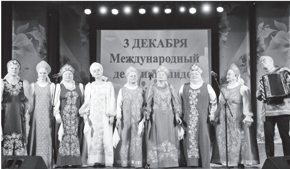
Артисты исполнили душевные песни.