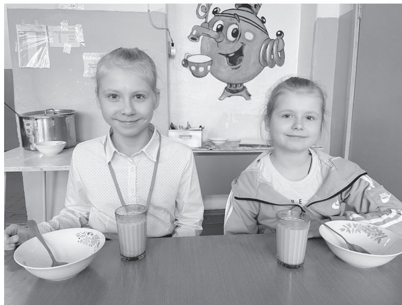
Пустые тарелки – лучший комплимент повару.

чальная школа с 1 по 4 класс получает горячие завтраки. Они финансируются из трех бюджетов – федерального, регионального и местного. Стоимость одного завтрака составляет 70 рублей 38 копеек. Также у нас есть возможность организации горячих обедов. В школах учатся ученики, которые обедают бесплатно. К ним относятся дети с ограниченными возможностями здоровья. Законные представители приносят в школу заключение психолого-педагогической комиссии, пишут заявление. Стоимость завтрака составляет 23 рубля 30 копеек, а обеда – 40