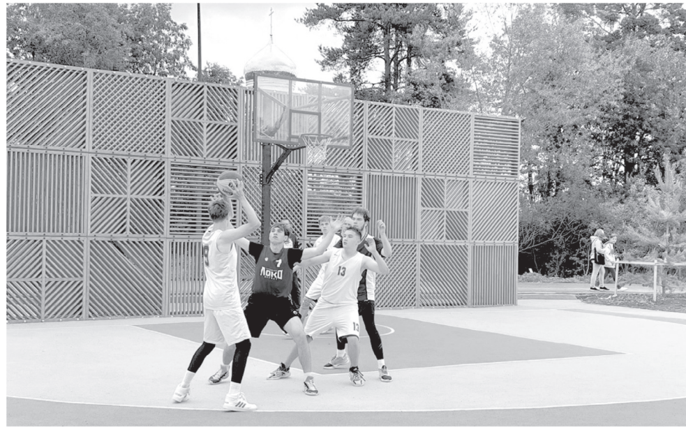
Новая спортплощадка в Удомле

“ Готовность к началу благоустройства должна быть обеспечена уже в марте 2024 года. Важно не затягивать эту работу, а делать максимально быстро и комфортно для жителей, чтобы эти объекты вовремя сдать.