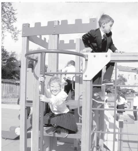
Детская площадка в Нелидово

В Бологом будет обустроен спуск на набережную озера, в поселке Озерный появится новая зона отдыха в парке перед храмом им. Святого апостола Андрея Первозванного, в Конаковском районе обновят городскую площадь,