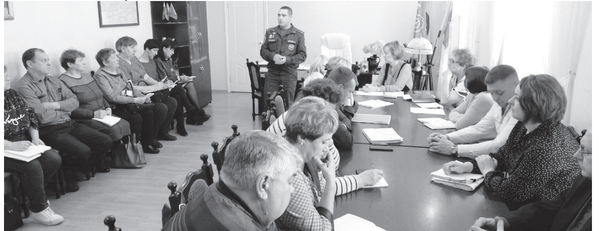
Выступает представитель Госпожнадзора.