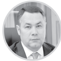
ИГОРЬ РУДЕНЯ Губернатор Тверской области

В планах на следующий год — провести работы в парках, скверах, на набережных и во дворах. Всего в Тверской области по этой программе будет благоустроено 65 объектов — 50 общественных пространств и 15 дворов в 37 муниципалитетах.