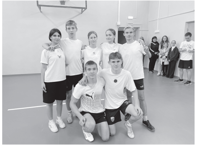
Команда школьников перед игрой.