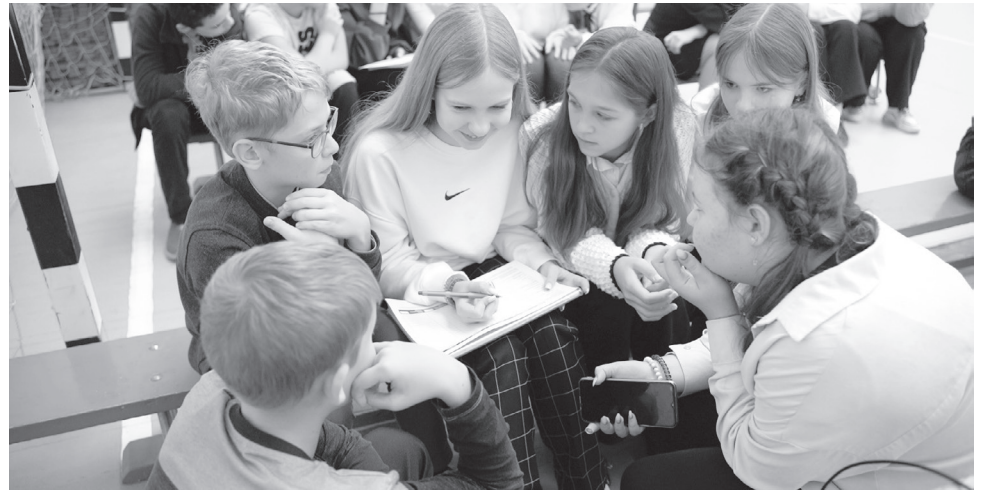
Школьники выполняют одно из заданий.

В Тверской области проходит Месяц финансовой грамотности. На различных площадках для жителей региона всех возрастов организуются тематические мероприятия.