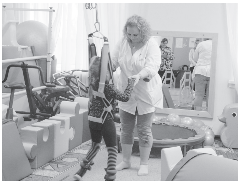
Центр оснащен высокотехнологичным оборудованием.

На учете в реабилитационном центре состоят и дети-инвалиды, имеющие тяжелые множественные нарушения в развитии, которые в силу своих заболеваний не имеют возможность