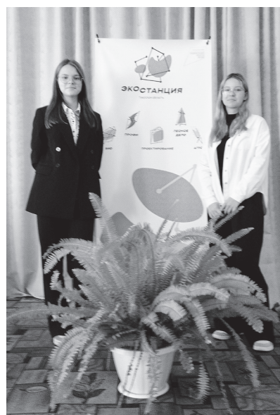
Юные натуралисты из гимназии №7.

На базе Областной станции юных натуралистов состоялась традиционная конференция финала регионального этапа Всероссийского конкурса «Я в АГРО» (Юннат) для защиты опытно-исследовательских и проектных работ учащихся в области сельского хозяйства и агроэкологии.