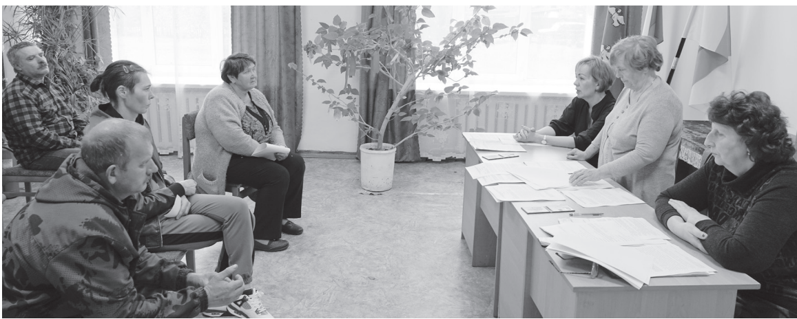
На первом заседании в Большесвятцовском сельском поселении.

В Единый день голосования в восьми муниципальных образованиях Торжокского района прошли выборы депутатов местных советов. В эти дни новые избранные приступают к своим обязанностям. В сельских поселениях проходят первые организационные заседания, которые ведет старейший из депутатов.