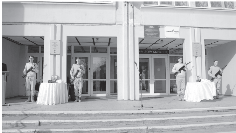
Мемориальные доски установили на здании школы.