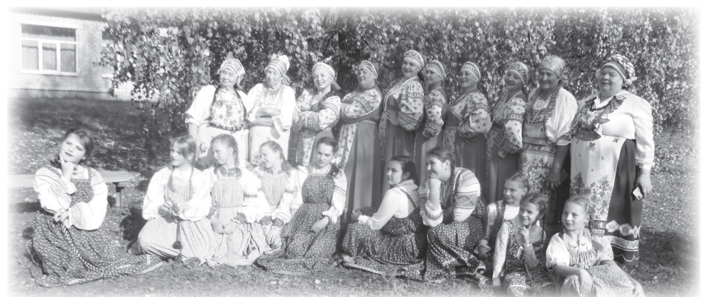
Артисты из Грузии.