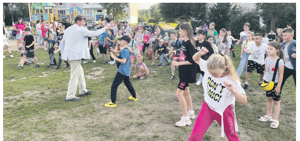
Повеселились от души.