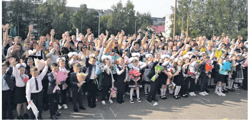
Ученики исполняют гимн средней школы №5.

1 сентября наша страна отмечает первый осенний праздник – День знаний. В каждом из нас он вызывает самые теплые и светлые чувства. Особенно волнующий этот день для первоклашек, для которых прозвенел первый школьный звонок. А у выпускников наступает нелегкая пора – подготовка к экзаменам.