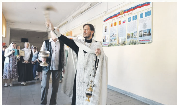
В средней школе №8.