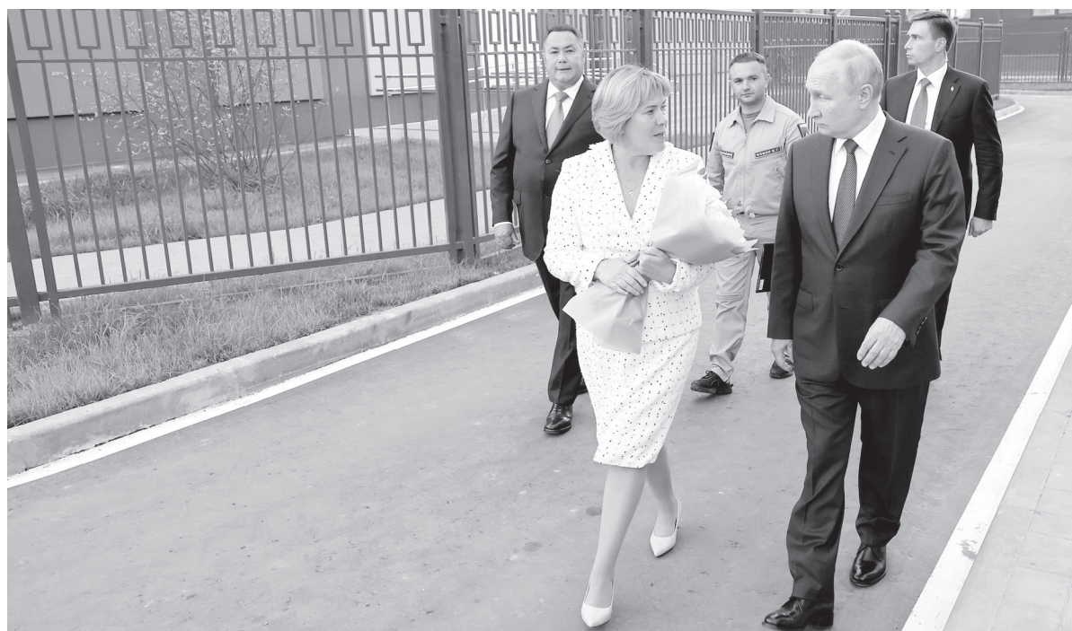
Глава государства высоко оценил качество строительных работ.

Помещения Дома культуры укомплектованы всем необходимым оборудованием, концертный зал рассчитан на 200 мест. Здесь будут размещаться вокальный и хореографический классы, зал