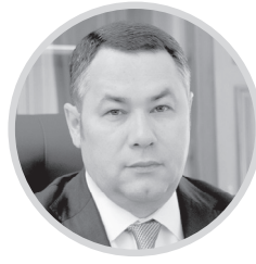
ИГОРЬ РУДЕНЯ Губернатор Тверской области