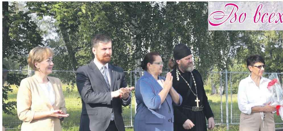
В Мошковской средней школе.

Долгожданная встреча, теплые взгляды, улыбки на лицах. Море цветов и добрые пожелания в адрес учителей, учеников и их родителей. Во всех школах Торжокского района – праздничная атмосфера.