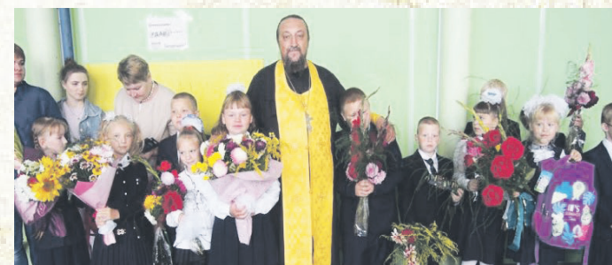
Школьники получили благословение.