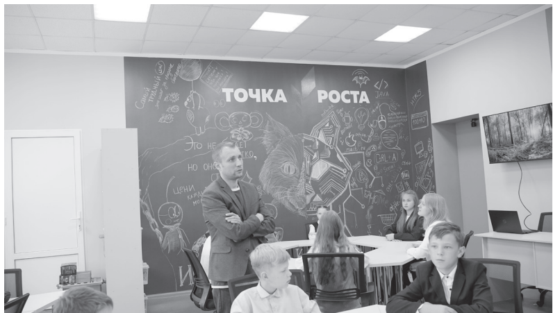
Недавно «Точка роста» была открыта в средней школе №8.