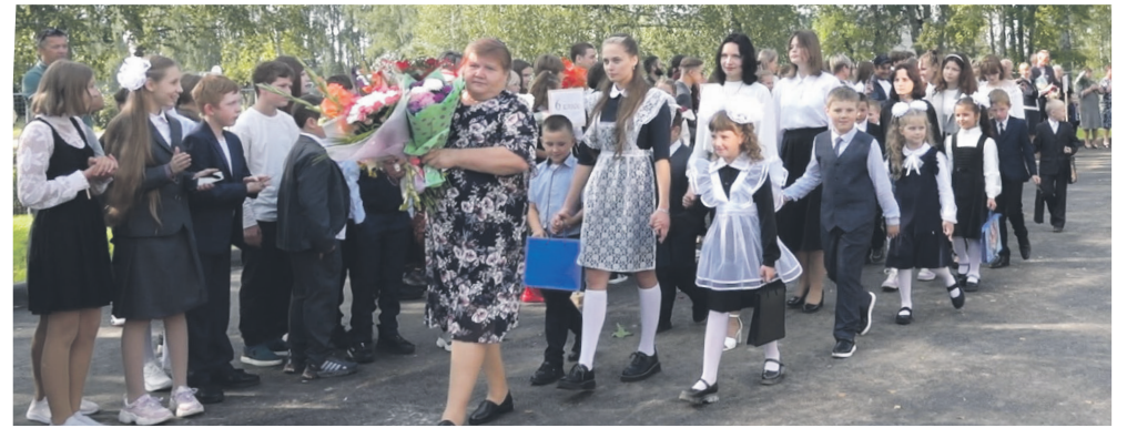
В добрый путь, первоклассники!