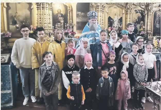
В храме Архангела Михаила.

Молебен на начало учебного года – полное название такого молитвенного чинопоследования «Молебное пение при начатии учения отроков» – это особый чин, в котором молящиеся просят Божией помощи и благословения в постижении и разумении доброго и душеполезного учения. Молятся в этот день не только об учениках, но и об их учителях.