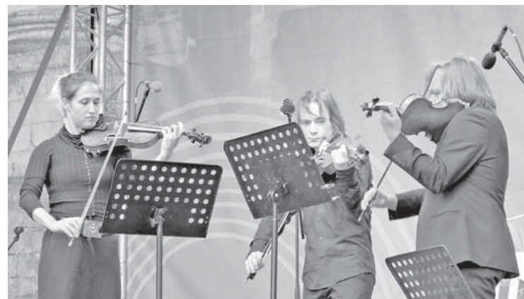
Момент выступления артистов.

Удмуртской Республике, Владимирской и Тюменской областях. Музыканты такого высокого уровня неслучайно выбрали для концерта нашу территорию. Ведь усадьба «Знаменское-Раёк» вдохновляет на творчество, входит в число самых неповторимых исторических памятников – творений нашего знаменитого земляка Н.А. Львова.