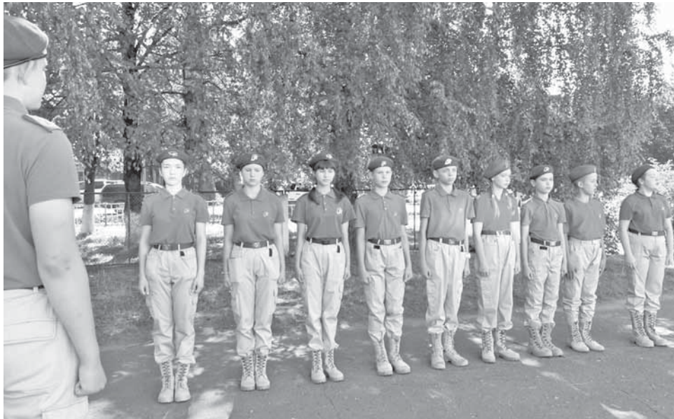
Для ребят была организована насыщенная программа.