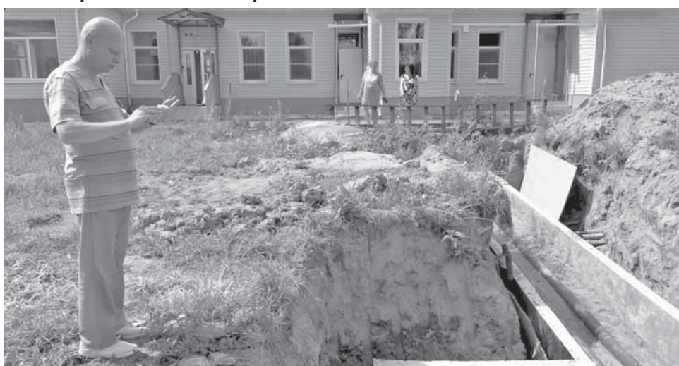
Первый этап строительства завершён.

На строительной площадке газовой теплогенераторной и тепловых сетей в селе Грузины уже завершён один из этапов строительных работ на теплотрассе.