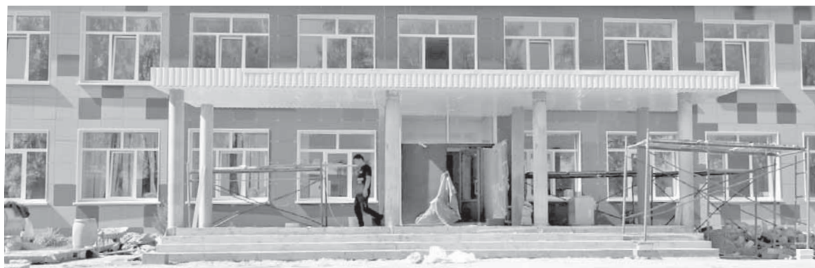
Обновленное образовательное учреждение.

Состоялась очередная рабочая поездка главы Торжокского района Елены Хохловой в Мошковское сельское поселение. На особом контроле у руководителя муниципального образования – капитальный ремонт общеобразовательной школы в деревне Мошки.