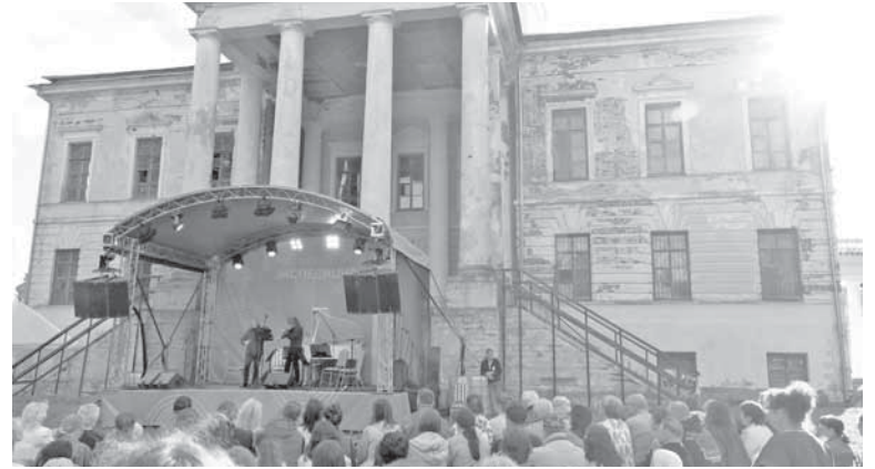
Сцена была установлена у главного дома усадьбы.