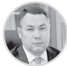
ИГОРЬ РУДЕНЯ Губернатор Тверской области

Впоследствии западная хорда в Тверской области должна соединить федеральные магистрали, проходящие через Верхневолжье (М-9, М-10 и М-11). Благодаря ей гораздо легче будет добраться до истока Волги и Селигера в Осташковском районе — это знаковые туристические места региона, где расположено много культурных