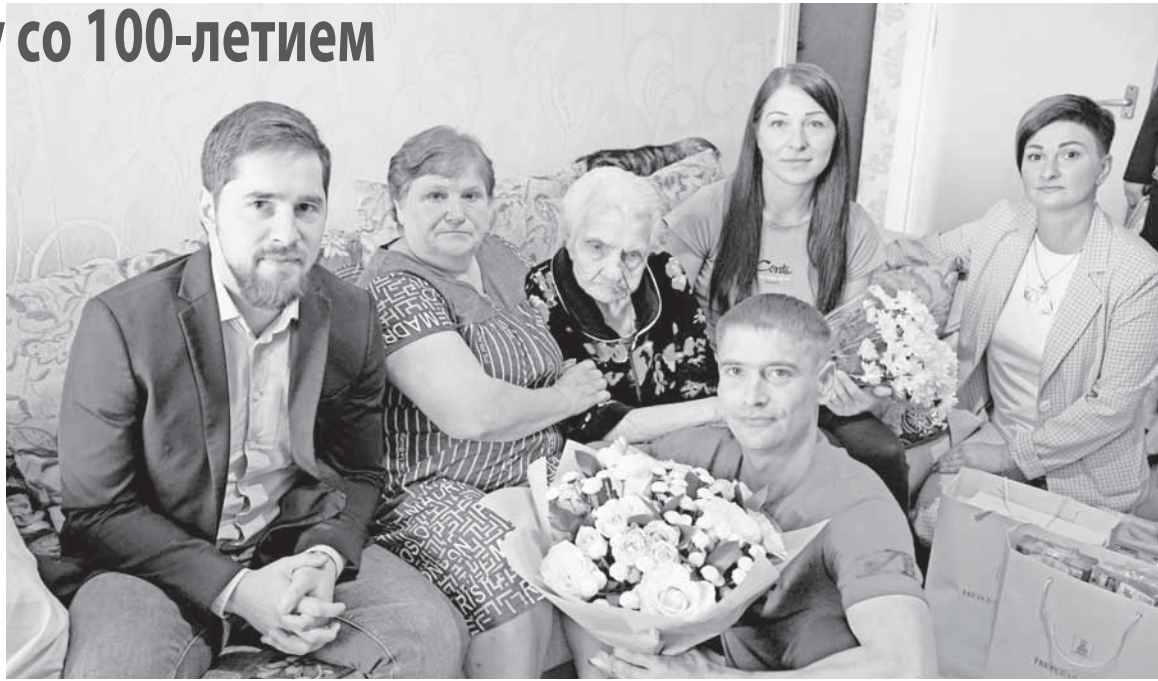
Фото на память с гостями и родными.