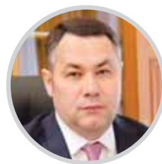
ИГОРЬ РУДЕНЯ Губернатор Тверской области

« В прошедшем году нам удалось максимально сохранить объемы промышленного производства. В текущем году наши предприятия демонстрируют рост. У нас развиваются машиностроение, производство компьютерной техники, электрооборудования, металлоизделий и другие направления. Многие предприятия в ситуации санкционного давления смогли открыть дополнительные производственные линии, укрепили свои позиции на внутреннем рынке. »