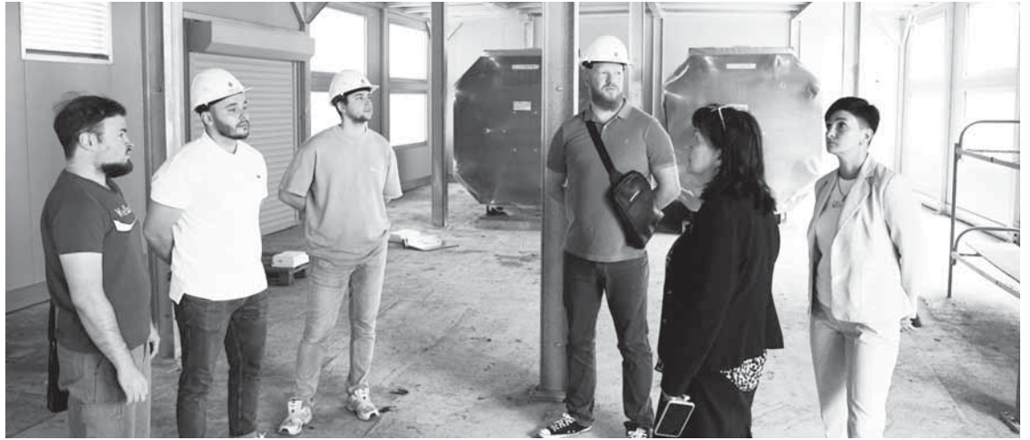
На строительном объекте.