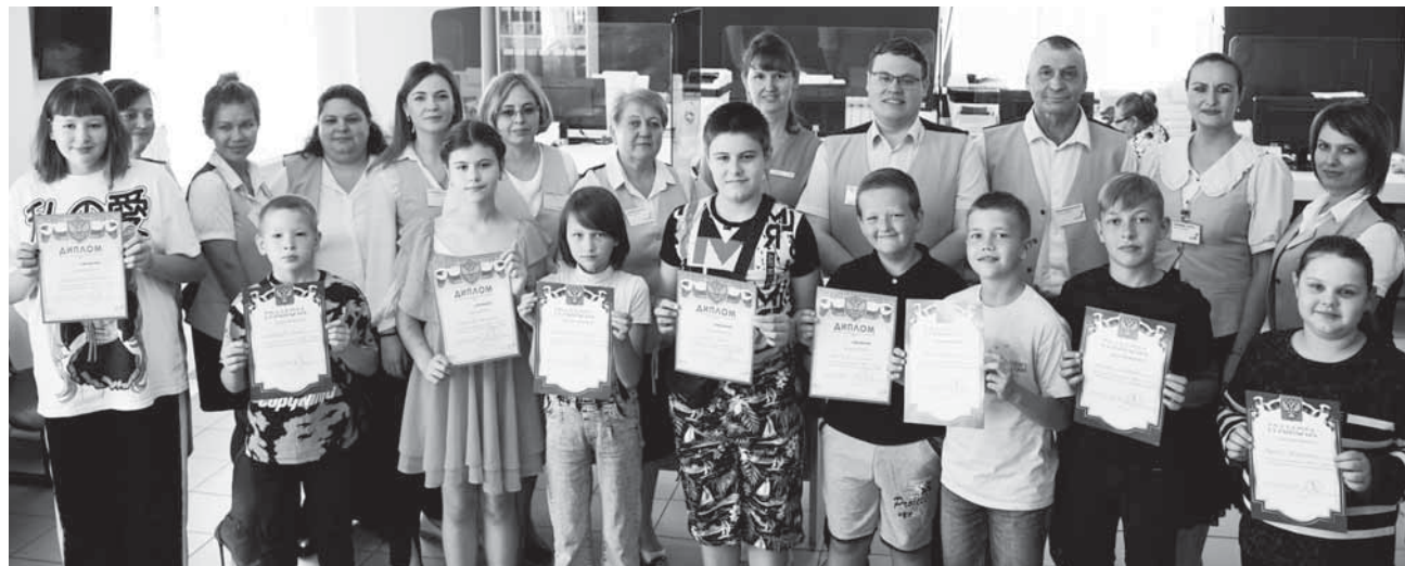
Дети с сотрудниками МФЦ.