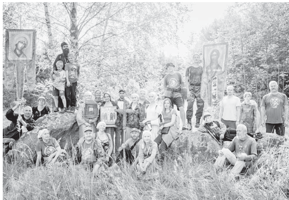
Остановка в пути.