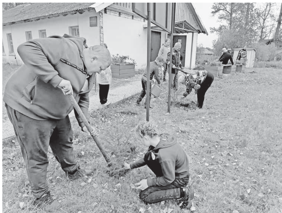
В честь героев-односельчан.

В рамках реализации проекта «Сохраняем будущее села» при поддержке Фонда президентских грантов РФ в Борисцевской сельской библиотеке прошла патриотическая акция «Мы помним героев-земляков». Ее участниками стали ветераны, дети, молодежь, волонтеры.