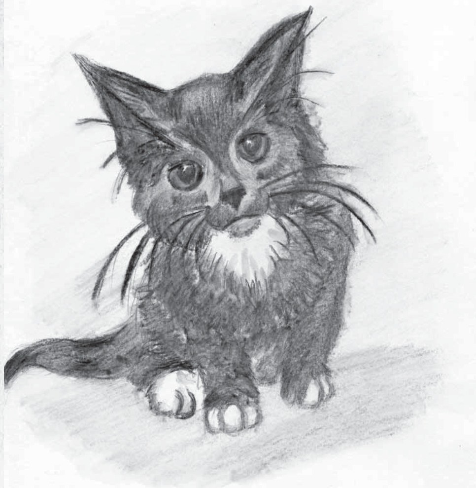
Рисунок Алексея Белова.

...Я просыпаюсь от странных звуков, доносящихся из сада. Прислушиваюсь какое-то время и понимаю, что