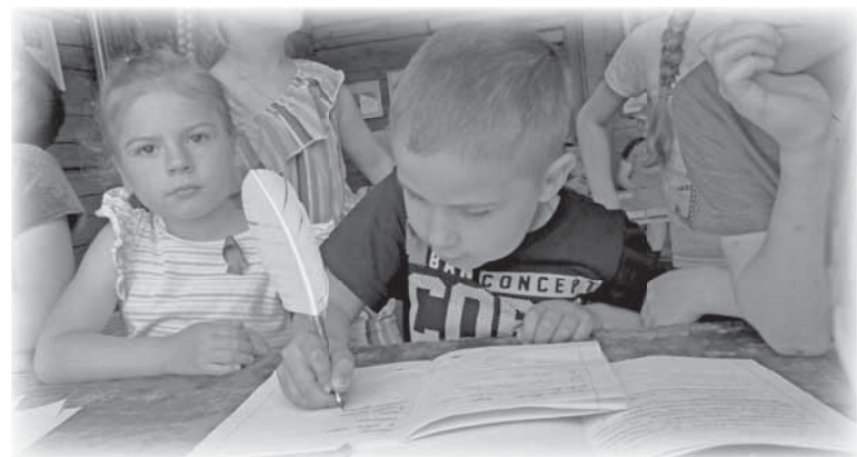
...писать стальным перышком.