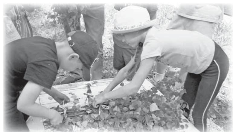
Дети учились вязать березовые венки...