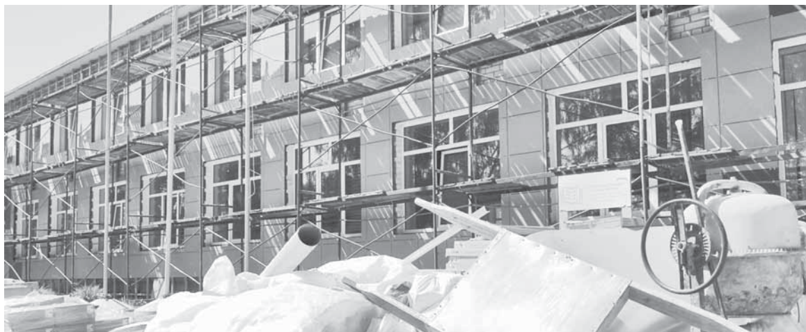
Обновляется фасад школьного здания.

Людмила СПИРИДОНОВА.