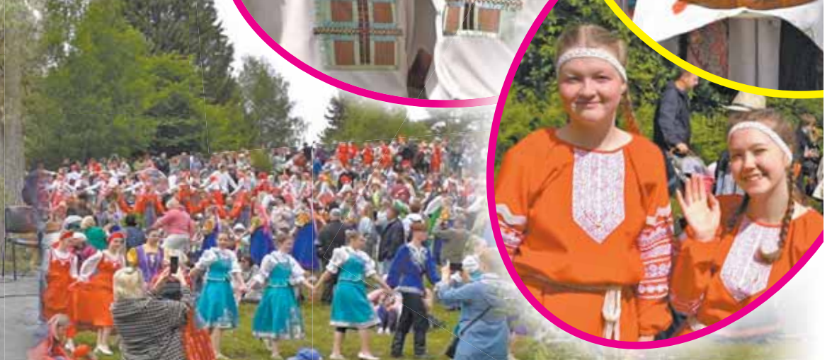
Большой хоровод объединил участников и гостей праздника.