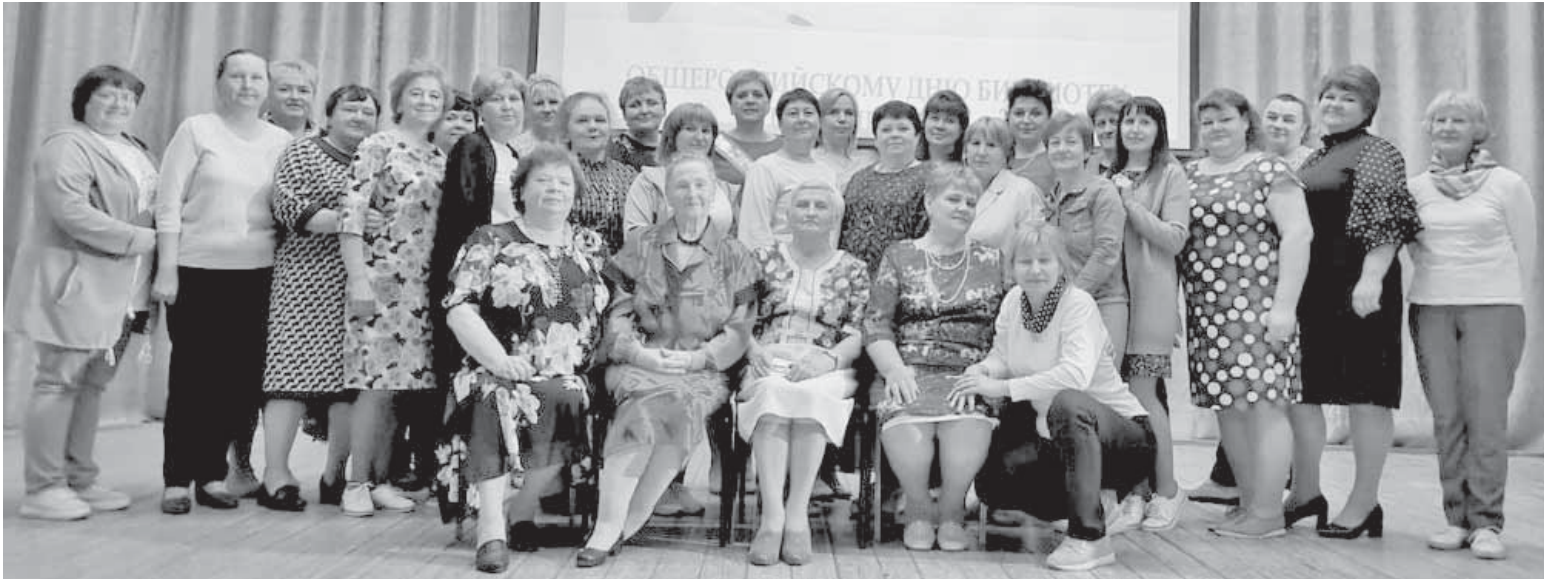
Дружный коллектив библиотечной системы района.

Библиотекари Торжокского района собрались в Славнинском сельском клубе, чтобы в кругу друзей, коллег, единомышленников отметить прошедший Общероссийский день библиотек, пообщаться друг с другом в неформальной обстановке, поздравить ряд библиотек и библиотекарей с юбилейными датами.