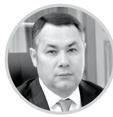
ИГОРЬ РУДЕНЯ Губернатор Тверской области

Развитие системы скорой медицинской помощи стало основной темой очередного заседания Правительства Тверской области. По итогам обсуждения глава региона Игорь Руденя дал несколько поручений: разработать быстрые и удобные маршруты транспортировки пациентов в больницы, доукомплектовать бригады и подстанции медперсоналом, обеспечить федеральные трассы дополнительными бригадами СМП, продолжить модернизацию материально-технической базы и в постоянном режиме получать обратную связь от населения о качестве и доступности скорой медицинской помощи.