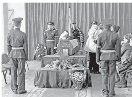
Военный комиссариат по городу Торжку, Торжокскому и Кувшиновскому районам.

Предварительная запись на прием – по тел. 9-29-41 .