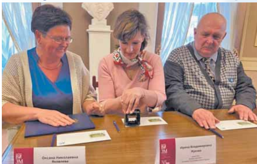
Торжественный момент – специальное гашение конверта.

Наследия архитектора Николая Львова усадьбе «Знаменское-Раёк» Почта России посвятила праздничный конверт.