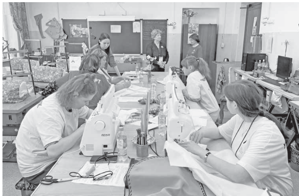
Продemonстрировали свои способности.