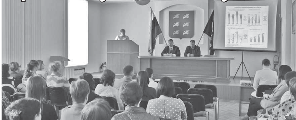
Во время слушаний.

Публичные слушания по вопросу об исполнении бюджета муниципального образования город Торжок за 2022 год состоялись во вторник в актовом зале городской администрации.