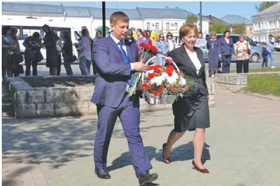
Руководители муниципалитетов возложили цветы к памятнику Н.А. Львову.