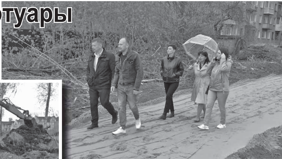
На Калининском шоссе.

пами. В планах – еще два на Калининском шоссе, их жители Торжка выбрали в 2022 году. Для победы в конкурсе обязательным условием является ежегодное участие в программе. Депутаты Торжокской городской Думы