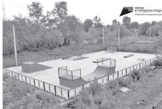
Так будет выглядеть площадка для занятий скейтбордингом.

Продолжается голосование за объекты городской среды, которые будут благоустроены в 2024 году по инициативе Президента России национального проекту «Жилье и городская среда». Свой выбор уже сделали более 33 тысяч жителей Верхневолжья, сообщает пресс-служба регионального Правительства.