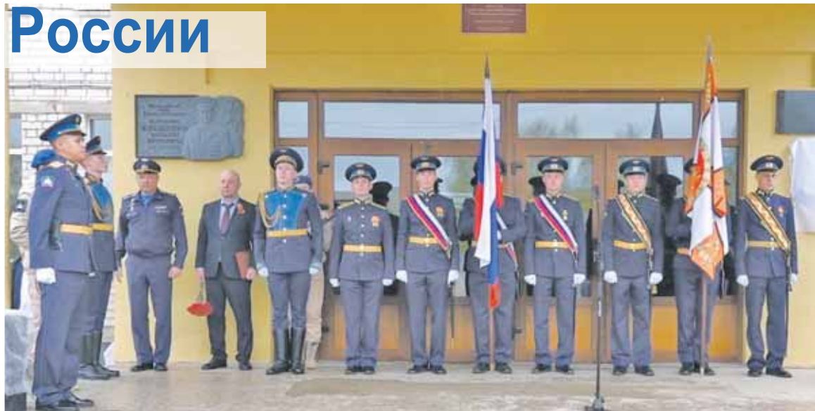
На торжественной церемонии.