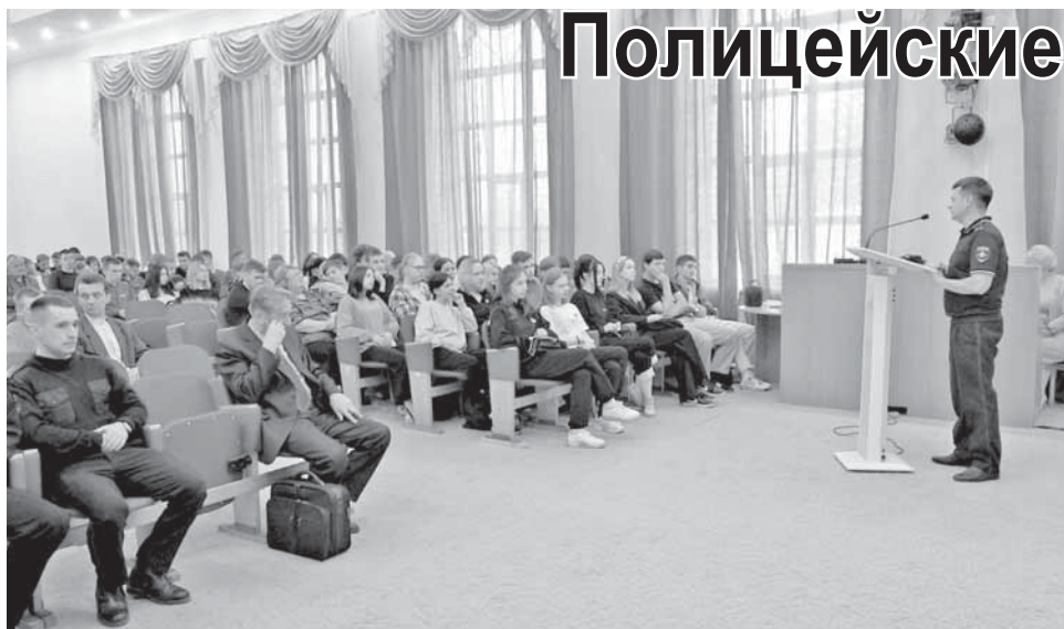
В колледже Росрезерва.