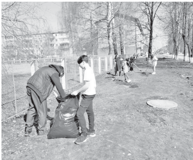
Школьники наводят порядок (средняя школа №6).

Внесли свой вклад в общее дело и самые маленькие новоторы. К примеру, мальчишки и девочки из старших групп детского сада №11 убрали территорию прогулочной площадки. Взрослые уверены: приучать детей к труду нужно с детства.