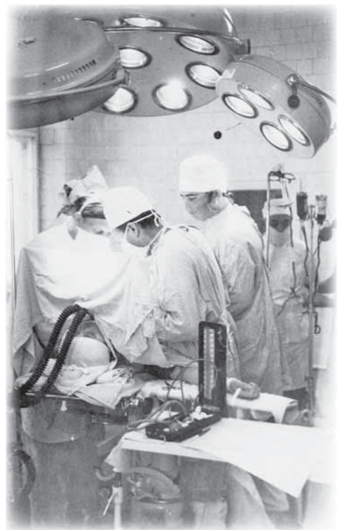
Во время операции.