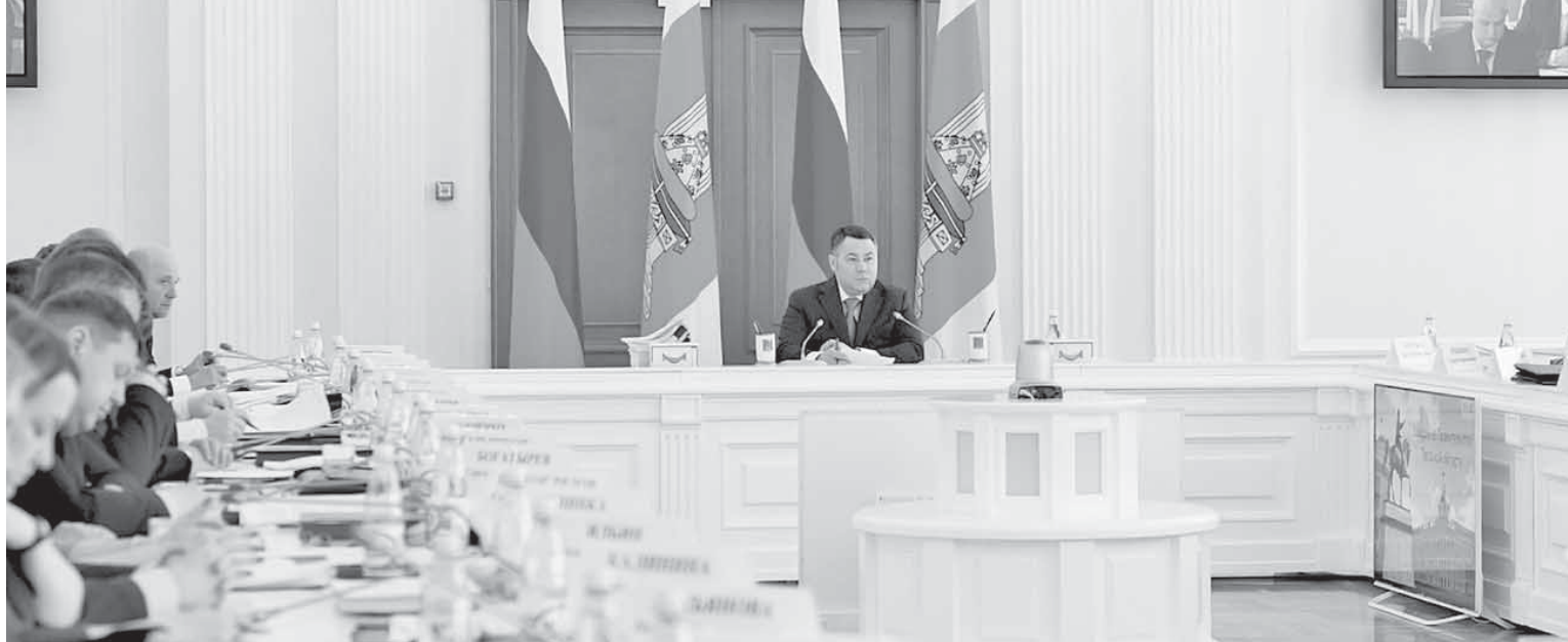
На заседании Правительства Тверской области 18 апреля.