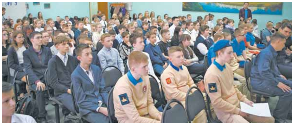
Урок мужества объединил учеников разных классов.

Такое название получил урок мужества, который прошел в средней школе №5 имени Героя России В.П. Клещенко.