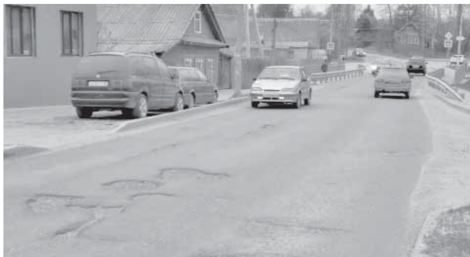
Улица Луначарского, у моста через ручей Больничный.

Еще один подрядчик – это ООО СК Арди, который проводил работы в 2021 году, гарантийные обязательства рассчитаны на 6 лет, до 2027г. Это ремонт дороги на 1-м пер. Гоголя (от пер. Зеленый до д. 44, 2-й Зеленый пр-д, щебеночные дороги).