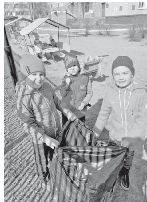
Участвуют в уборке и дошколята.

Навели порядок на пришкольной территории и даже за ее пределами ребята из средней школы №6. Работа у них спорилась: вместе делать полезное дело веселее!