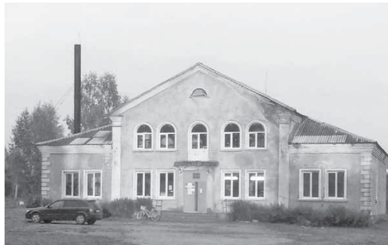
В Масловском сельском клубе заменили трубу.

Расходы направлялись на капитальный ремонт учрежде-