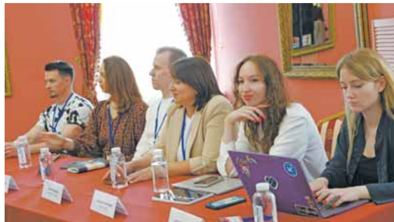
Спикерами стали успешные предприниматели и общественники.

– Сегодня в Торжке стартовал первый форум, но я надеюсь, что это станет хорошей традицией и, возможно, он будет проводиться не один раз в год. Поздравляю с началом. У этого проекта большой путь с поддержкой администраций города и района и Тверского региона.