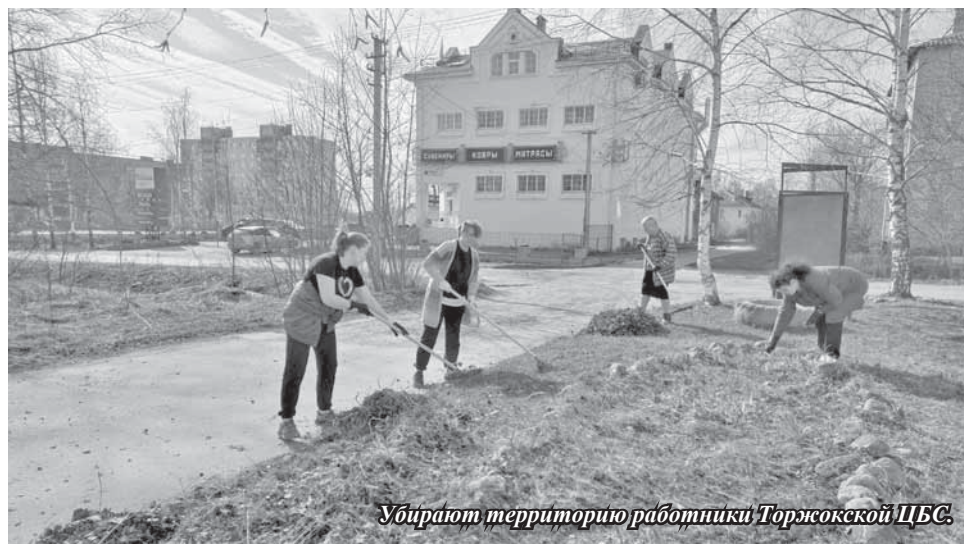
Убирают территорию работники Торжокской ЦБС.