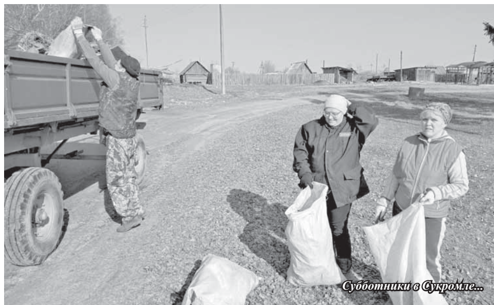
Субботники в Сукромле...

В Торжокском районе с 17 апреля объявлен двухмесячник по благоустройству территорий населенных пунктов.