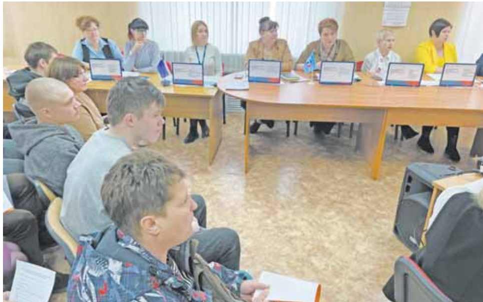
В мероприятии приняли активное участие работодатели.

Не упустить свой шанс и найти работу. Такая возможность была предоставлена гражданам, ищущим работу, а также студентам города во время Всероссийской ярмарки трудоустройства «Работа России. Время возможностей». Она прошла в минувшую пятницу на базе Торжокского филиала службы занятости населения Тверской области.