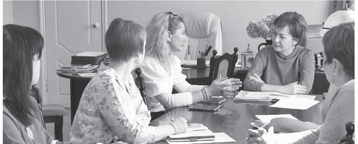
Во время встречи.

В администрации Торжокского района состоялся разговор заинтересованных сторон по воссозданию культурного наследия и памятников архитектуры на территории муниципального образования.