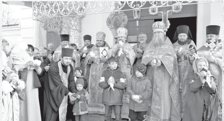
Митрополит Амвросий с детьми выпустили голубей.