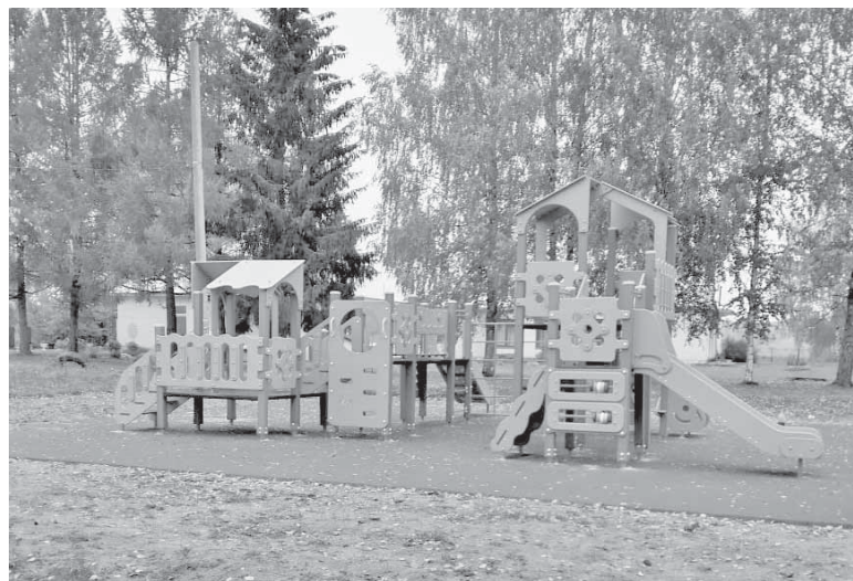
Детская площадка в д. Осташково.

А. АЛИНА.