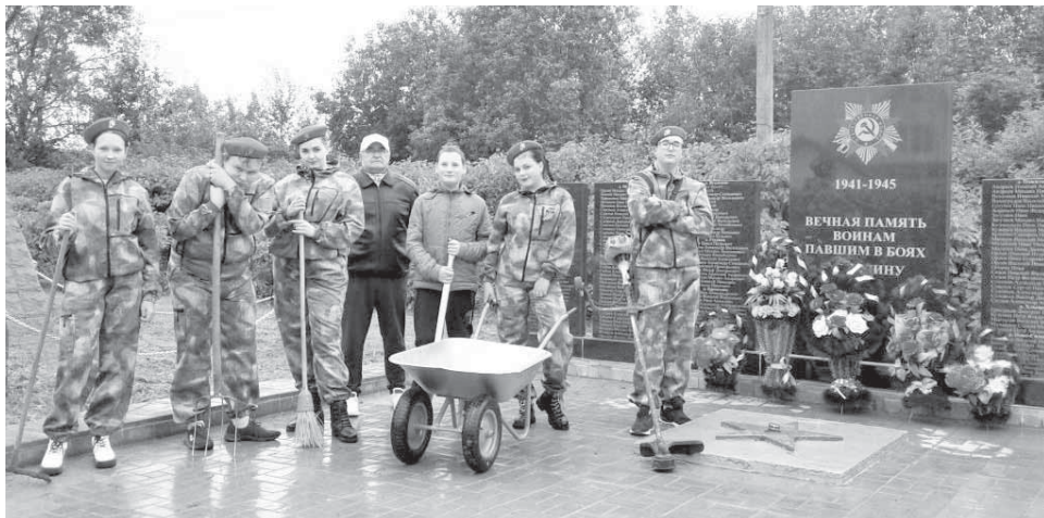
Учащиеся Мошковской школы ухаживают за воинскими захоронениями и мемориалами.

задачей является улучшение санитарно-гигиенического и эстетического вида поселения, озеленение и повышение комфортности проживания граждан. Вопросы благоустройства – это не только финансовые затраты, это прежде всего человеческий фактор.