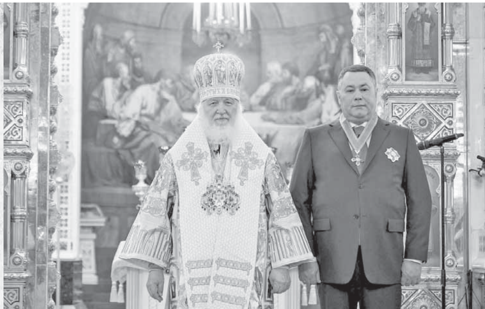
Патриарх Кирилл и губернатор И.М. Руденя.