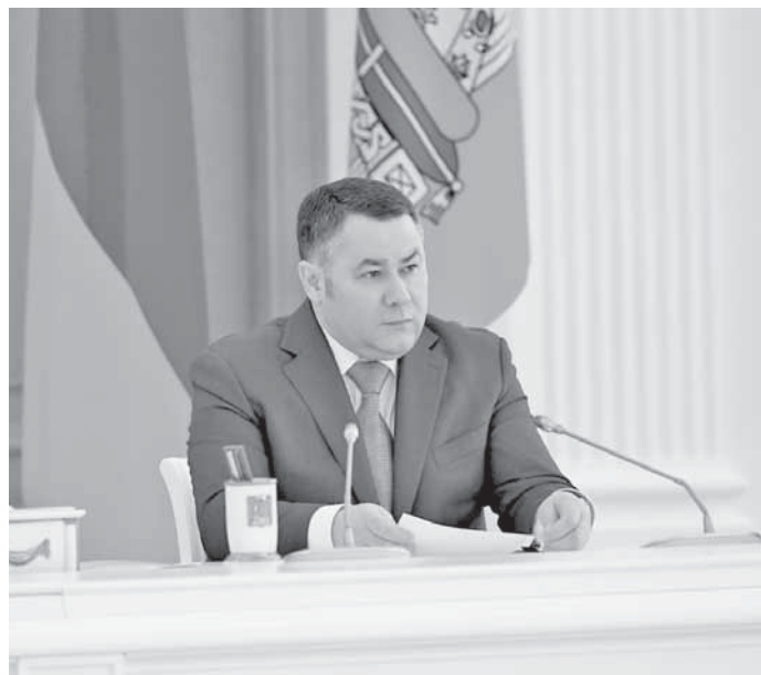
Губернатор Тверской области И.М. Руденя.

Успешная работа Правительства Тверской области под руководством губернатора Игоря Рудени продолжается.