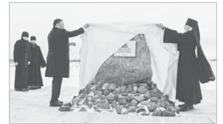
Губернатор Игорь Руденя и епископ Ржевский и Торопецкий Адриан открывают памятный знак на месте строительства храма

Новый храм будет построен в память о солдатах и офицерах, погибших в годы Великой Отечественной войны.