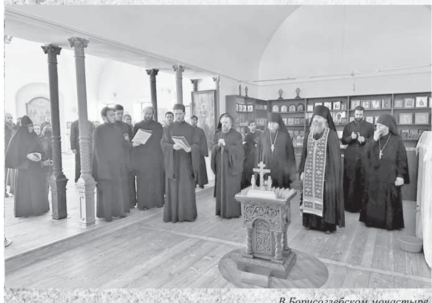
В Борисоглебском монастыре.

По материалам пресс-службы Тверской епархии.