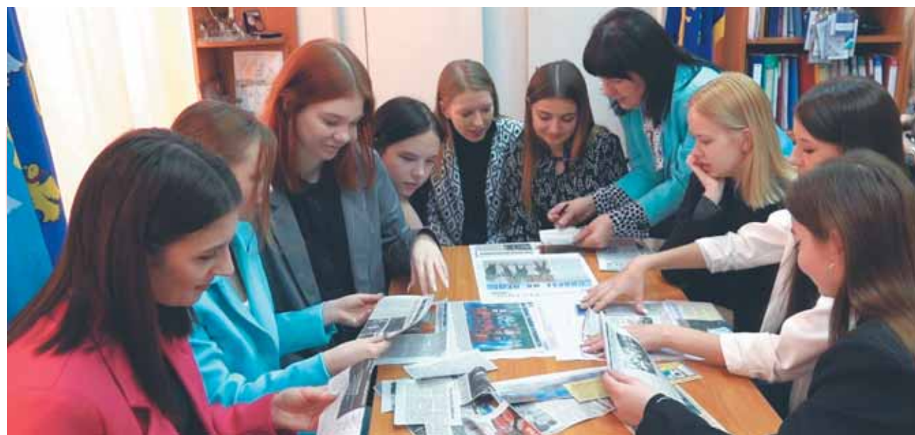
Девушки составляют макет газеты.

Накануне конкурса «Мисс Торжок-2023» его участницы побывали в редакции газеты «Новоторжский вестник». Такие встречи с конкурсантками уже стали традиционными.