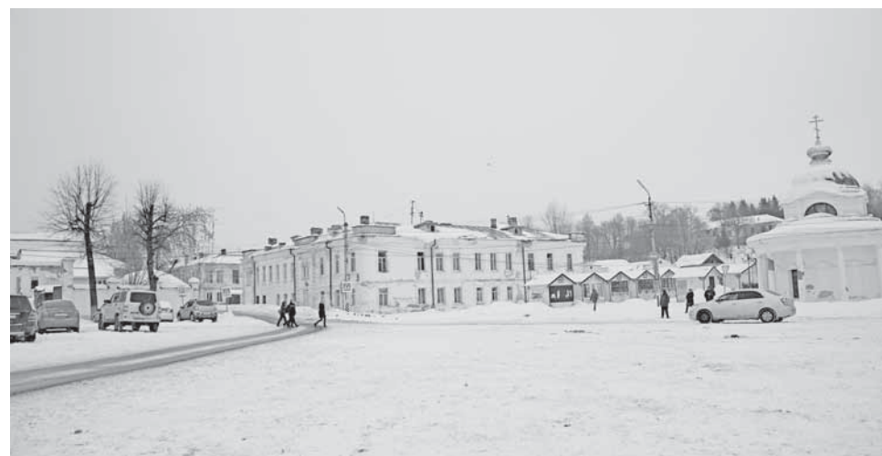
Площадь 9 Января.