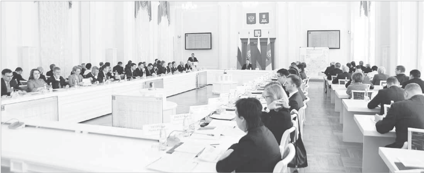
На заседании Правительства Тверской области обсудили подготовку к пожароопасному периоду на территории региона