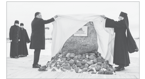
Губернатор Игорь Руденя и епископ Ржевский и Торопецкий Адриан открывают памятный знак на месте строительства храма

Новый храм будет построен в память о солдатах и офицерах, погибших в годы Великой Отечественной войны.