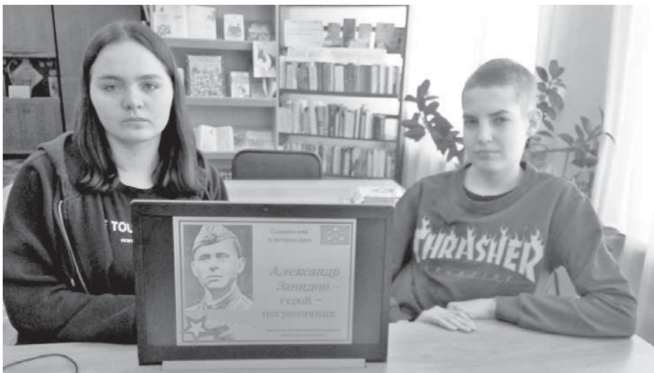
На уроке краелюбия.