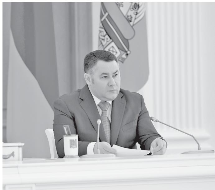
Губернатор Тверской области И.М. Руденя.

Успешная работа Правительства Тверской области под руководством губернатора Игоря Рудени продолжается.