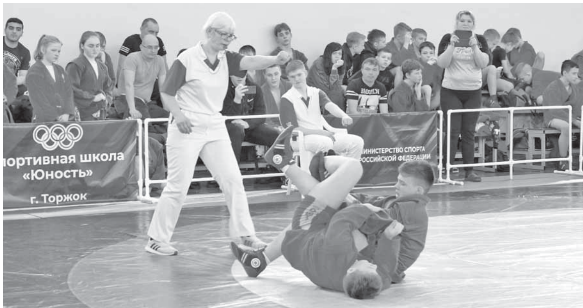
Поединки юных спортсменов были зрелищными.