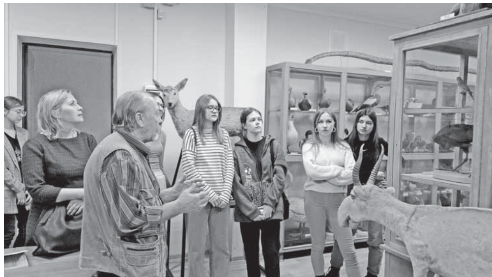
Гимназисты в выставочном зале биологического факультета ТвГУ.