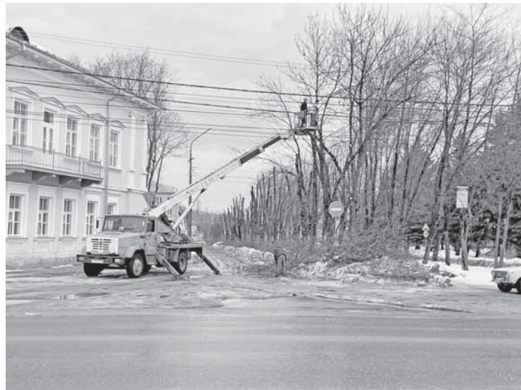
Опилка деревьев в районе улицы Студенческой.

Участниками замечательной концертной программы стали солисты и творческие коллективы города и района: народная вокальная группа «Ассоль», хореографический ансамбль «Гармония», студия современного танца Step forward, народный вокальный ансамбль «Новоторжские истоки», образцовая художе-