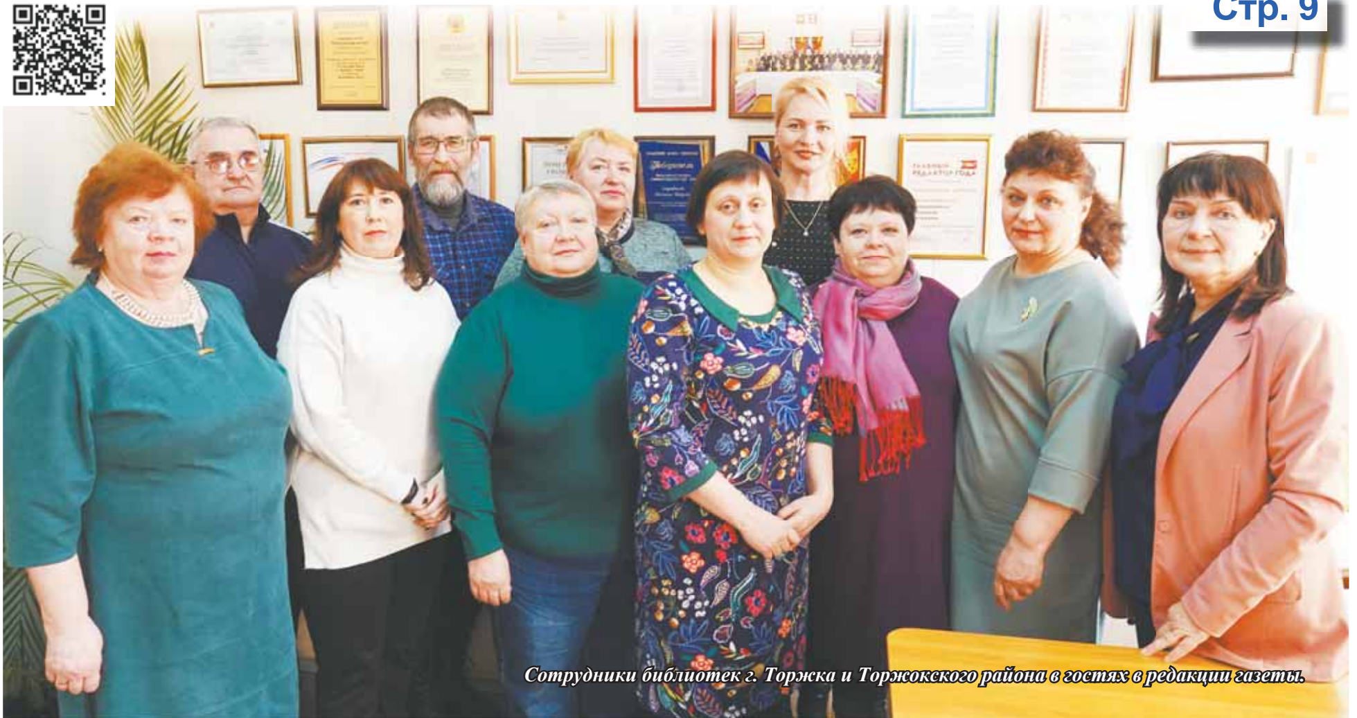
Сотрудники библиотек г. Торжка и Торжокского района в гостях в редакции газеты.