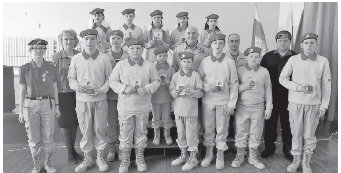
Школьники после посвящения сфотографировались с гостями.