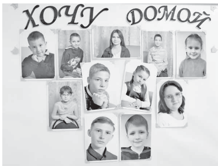
А эти дети ждут своих мам и пап.