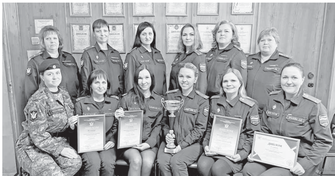
Коллектив отдела с заслуженными наградами.