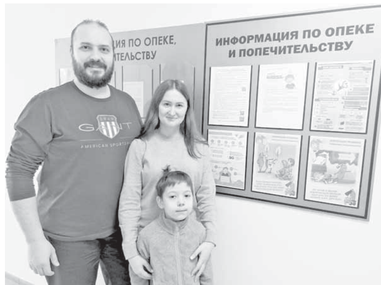
Еще один ребенок обрел семью.