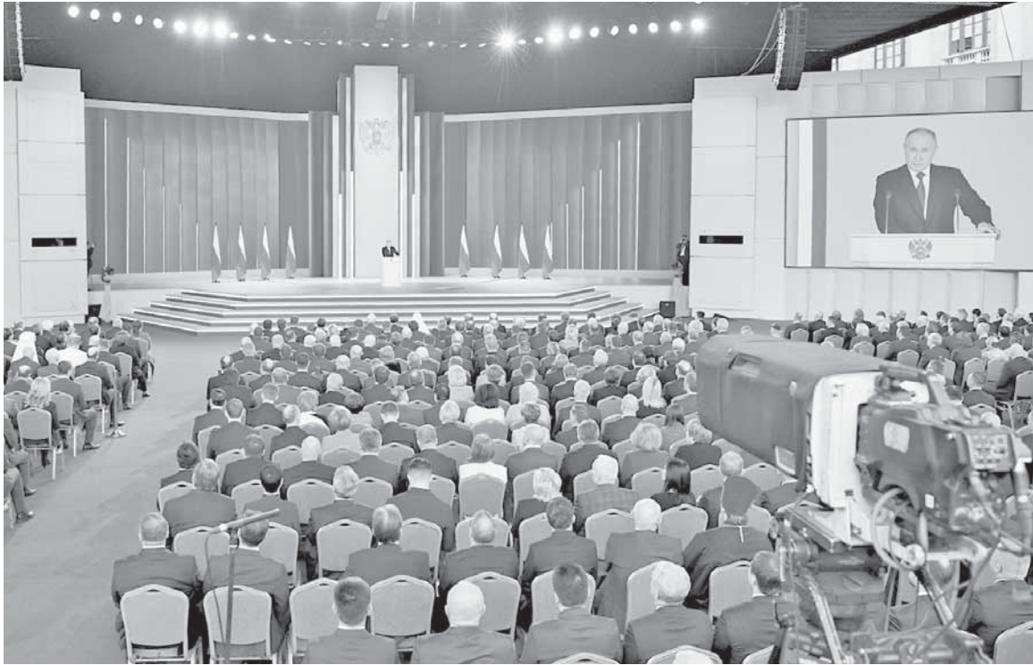
Выступает Президент Российской Федерации Владимир Путин.

21 февраля Президент России Владимир Путин выступил с Посланием Федеральному Собранию Российской Федерации. В мероприятии принял участие губернатор Тверской области Игорь Руденя, сообщает пресс-служба регионального Правительства.