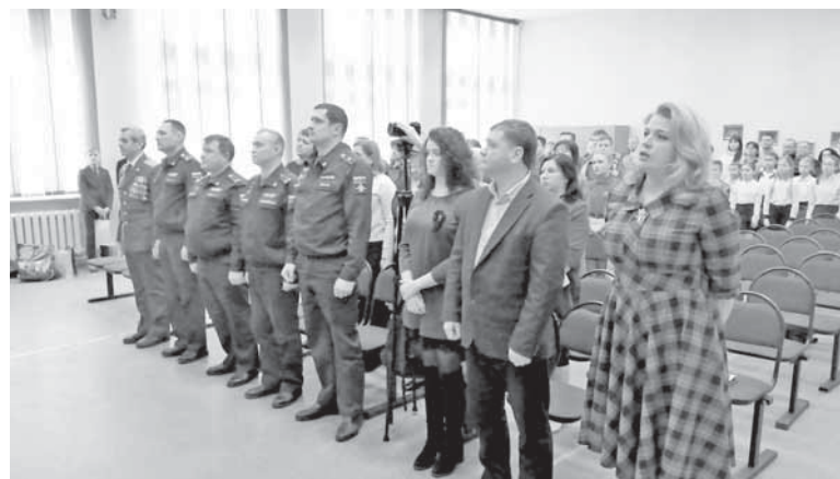
Звучит гимн Российской Федерации.