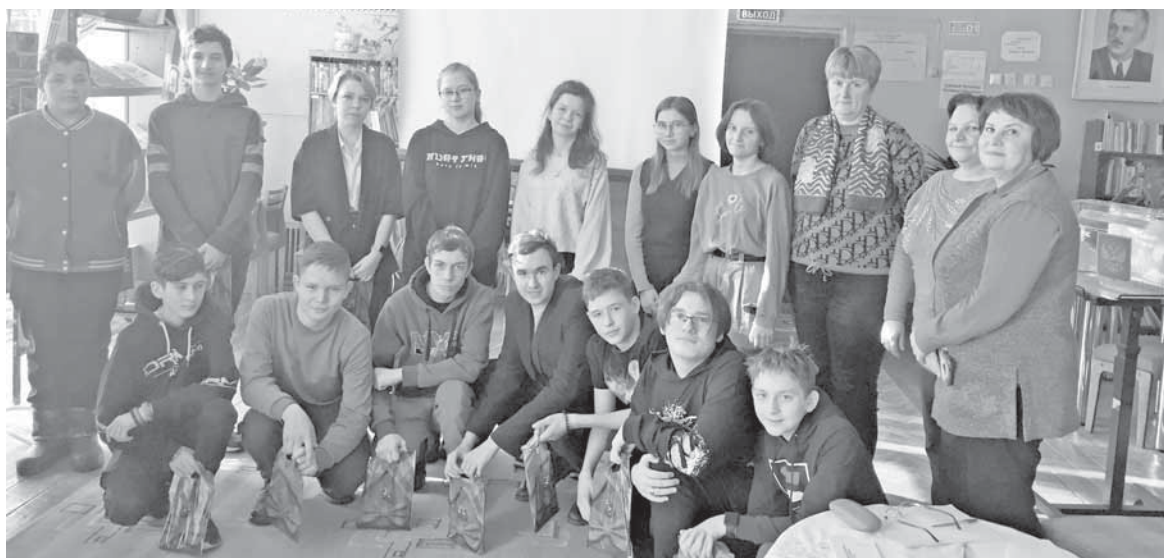
Участники игры с гостями.

манд («избиратели») в специально отведенном месте в бюллетенях ставили отметку за кандидата, затем опускали их в настоящую урну.