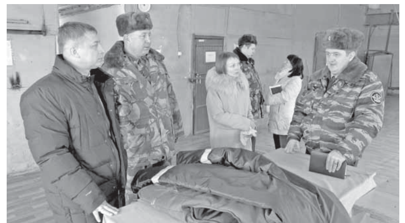
Гостей познакомили с работой производственных участков.

На выставке готовых изделий руководитель дал подробную оценку выпускаемой продукции. Сотрудники исправительного учреждения отметили, что в настоящее время на его территории открыт участок по художественной ковке, на котором изготавливаются решетки для окон, лавки, лестницы и другие изделия. В колонии организуются новые производственные участки для совместной работы с московскими и торжокскими заводами. Развивается и собственное производство. На швейном участке налажен