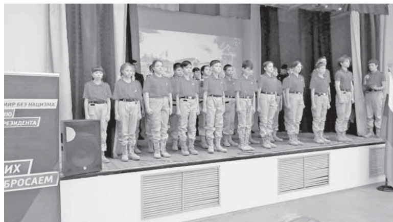
Юнармейцы дали клятву.

Накануне Дня защитника Отечества в средней школе №5 имени Героя России Василия Клещенко состоялось значимое событие – вступление учащихся в ряды Всероссийского патриотического общественного движения «Юнармия». В школе уже несколько лет действует юнармейский отряд «Беркут», и в этот день он пополнился еще 19 школьниками. Это ребята, которые проявили себя в разных направлениях – учебе, спорте, музыке. Одним словом, из 1100 учащихся школы чести быть юнармейцами удостоились самые лучшие мальчишки и девчонки.