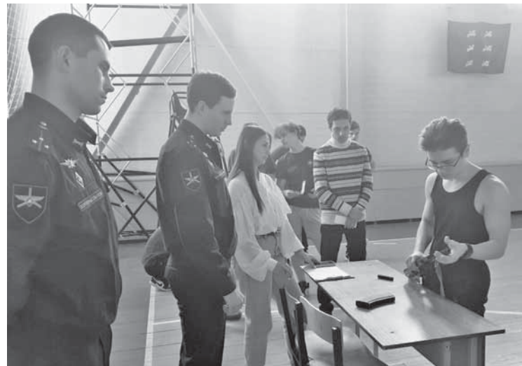
Одно из испытаний – сборка-разборка автомата Калашникова.