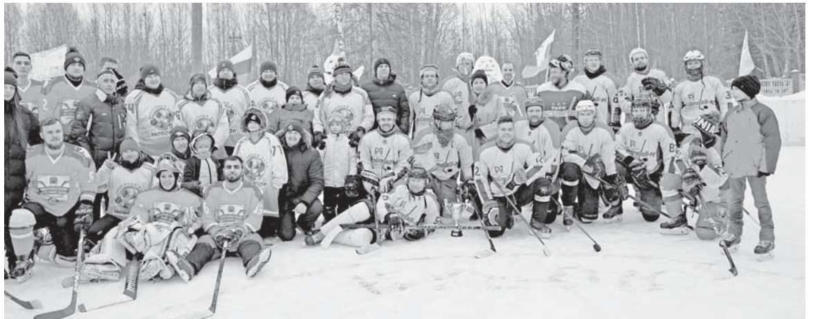
Хоккеисты и болельщики – одна дружная команда.

На катке Митинского детского дома в минувшие выходные прошел открытый турнир по хоккею с шайбой на кубок главы Торжокского района.